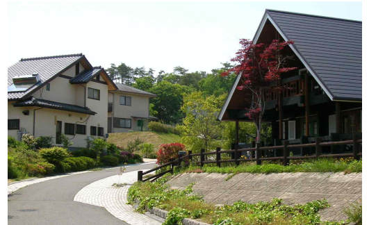
<기비고원도시 주택 단지 전경>