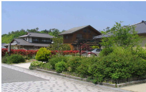
<기비고원도시 주택 단지 전경>