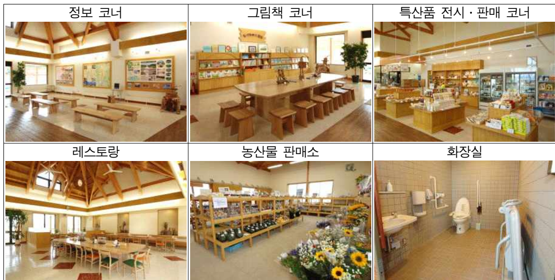
「미찌노 에끼」 내의 주요 시설