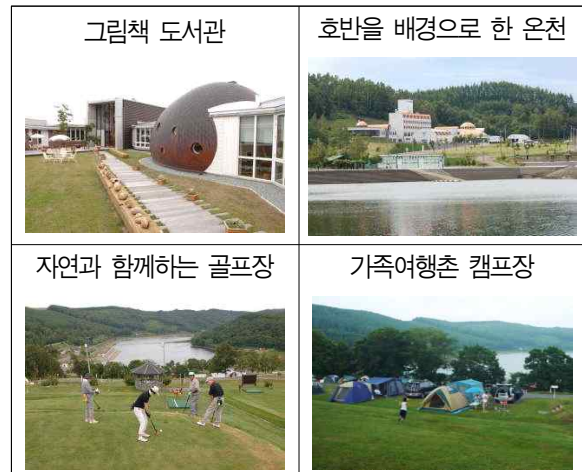
「미찌노 예끼」 주변의 주요 관광 자원

빼어난 언덕 위에는 자연의 특성을 살린 어린이부터 고령자가 동시에 이용할 수 있는 골프장(4 코스 36 홀)과 아름다운 호반을 배경으로 유명한 골프장(2 코스 18 홀)이 있다. 그리고 근처에는 사쿠라오카호수(桜岡湖)를 보면서 낚시·캠핑, 각종 스포츠, 곤충 채집 등 가족이 함께 즐길 수 있는 각종 시설들이 있다.