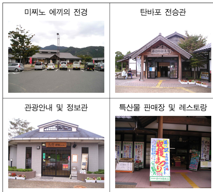
「미찌노 에끼」 내의 주요 시설