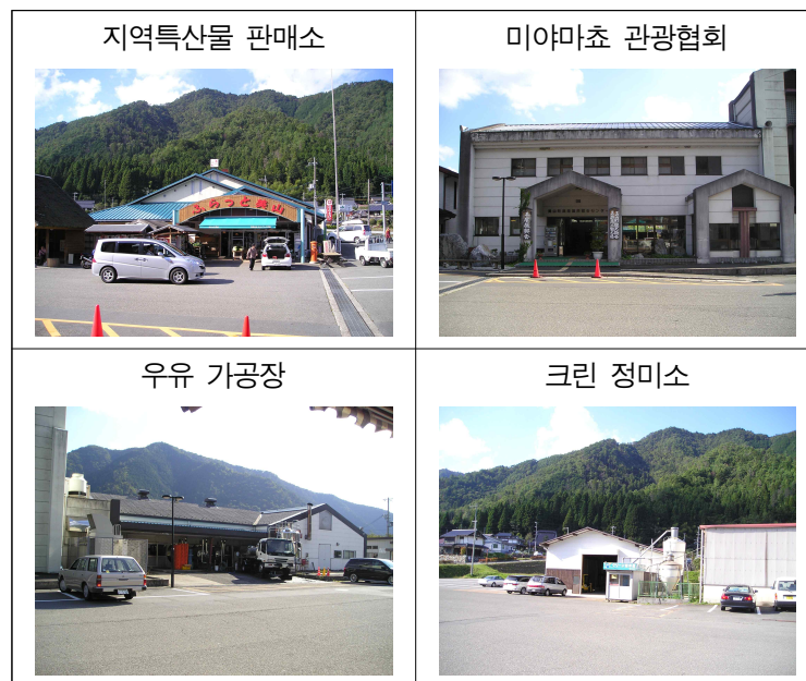
「미찌노 에끼」내의 주요 시설

그리고 정기적으로 매월 셋째 일요일은 지역주민과 방문객들이 가벼운 마음으로 함께 즐길 수 있는 「후랏토 만남의 날(ふらっとふれあいの日)」행사가 있다. 뿐만 아니라 관광협회 주최의 사진콘테스트나 회화콘테스트의 입선 작품을 전시 하고 있어 방문객의 볼거리를 제공하고 있다.