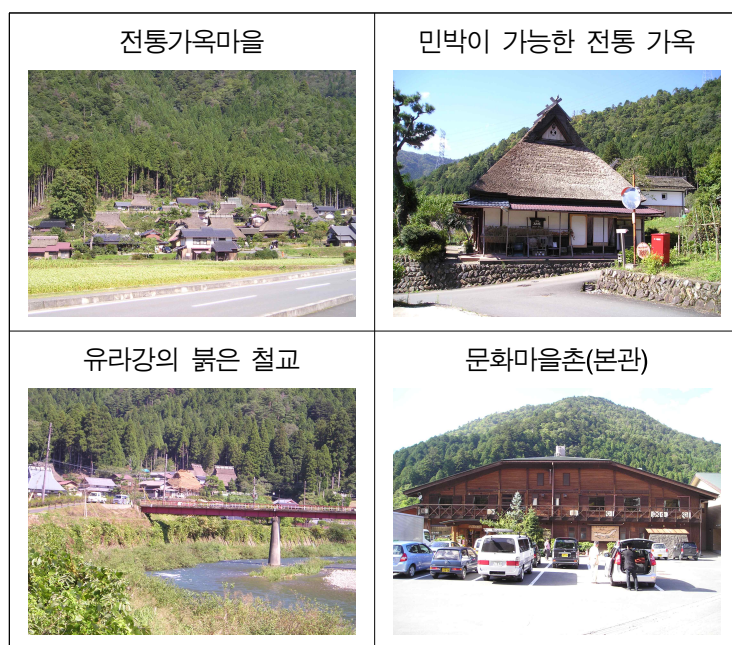
「미찌노 에끼」 주변의 주요 관광 자원

이처럼 「미찌노 에끼」인 『미야마 만남의 광장』은 주변의 관광자원과 연계되어 지역의 명물로, 지역교류의 장, 지역활성화의 거점으로 자리 매김하고 있다.