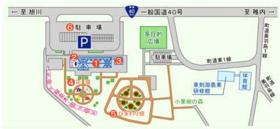
『그림책의 마을 켄부찌(繪本の里けんぶち)』의 배치도

특산품 전시·판매 코너에서는 현지 농산물을 이용한 켄부찌초의 대표적인 특산품을 모두 갖춰 놓고 판매하고 있다. 이 곳에는 켄부찌 지역의 전통 아이스크림(しそソフトクリーム)과 야채 주스 등이 유명하다. 농산물 직판소에서는 지역 생산자의 마음을 담아 재배한 친환경의 안심·안전한 농산물을 저렴한 가격으로 판매하고 있다. 그리고 레스토랑에서는 현지의 농산물을 이용하여 만든 차와 식사를 여유롭게 즐길 수 있다.