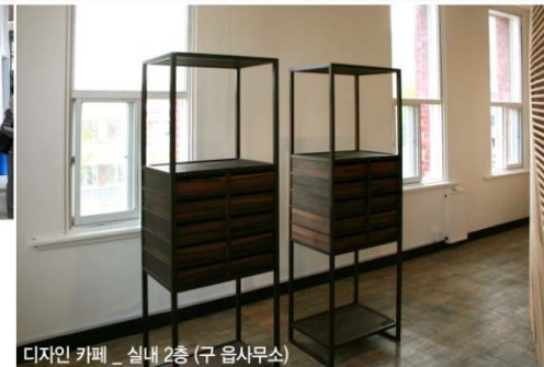
디자인 카페 _ 실내 2층 (구 읍사무소)