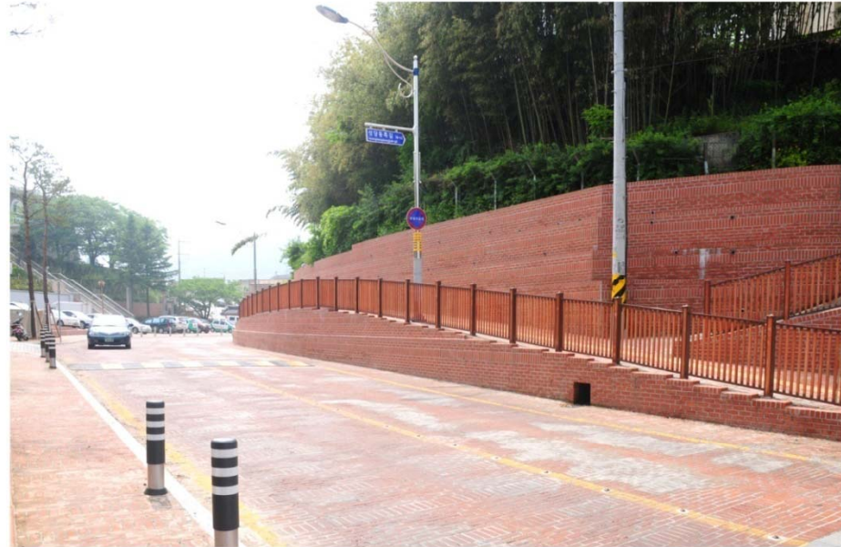
Culture street road

또한, 역사, 문화, 공공디자인을 접목시켜 디자인 문화거리를 조성하여 구도심 경제를 견인하는 시발점이 될 것입니다.