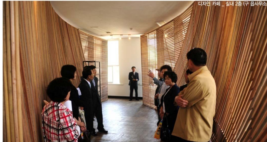
디자인 카페 _ 실내 2층 (구 읍사무소)

일상의 중심을 차지하고 있는 것은 동네 카페입니다. '일상의 행복' 프로젝트를 통해 우리는 디자인 생산 과정을 새롭게 생각해보고 유통과 소비의 기반을 은유하는 존재로서의 동네 카페를 선보이려 합니다. 전시 공간으로 재탄생 한 2층은 한국적인 건축과 조형이 조화된 디자인으로 건축가이자 환경디자이너인 김백선의 작품으로 꾸며집니다.