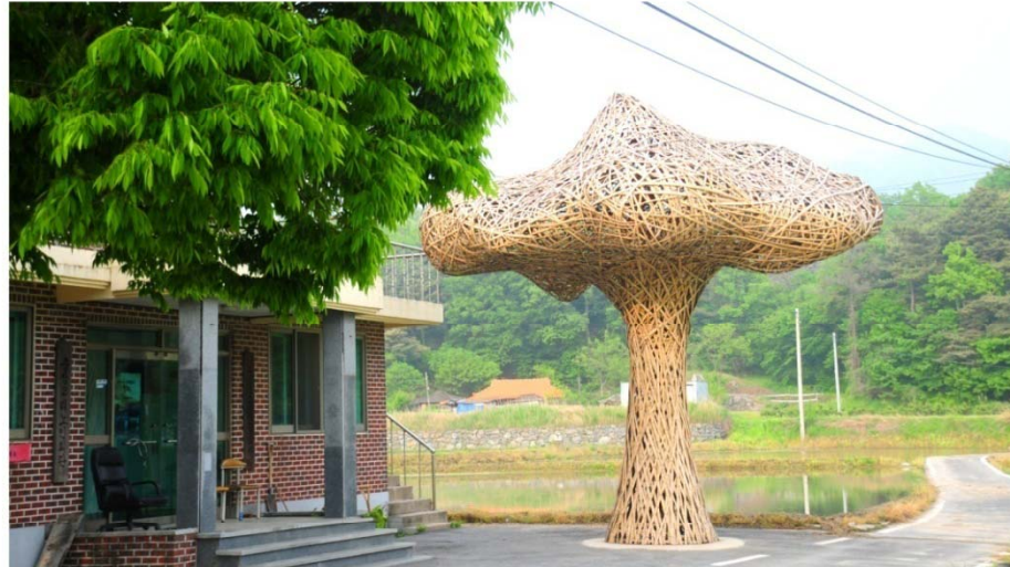
중장리마을의 이색적인 예술 작품들

문화체육관광부 2009 마을미술 프로젝트 길섶미술로 꾸미기 사업추진으로 농촌지역에 다양한 예술문화 체험의 장 조성 문화예술 소외지역을 대상으로 나눔과 소통할 수 있는 예술 마을조성으로 볼거리 즐길거리 제공으로 관광지 명소화