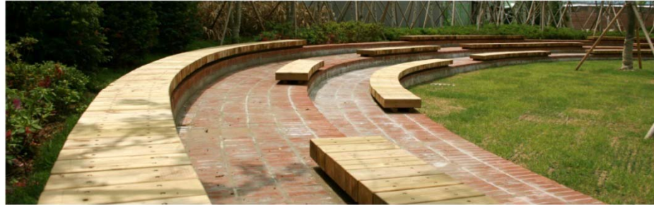
TIMELESS MUSIC PARK

박제된 폐허의 경험을 통해 시민들이 역설적으로 생명의 부활과 희망, 창조를 일상에서 찾는 공간으로, 바쁜 일상 속에서도 이곳의 정지된 시간을 통해 삶의 활력을 찾는 공간으로 다시 태어났습니다.