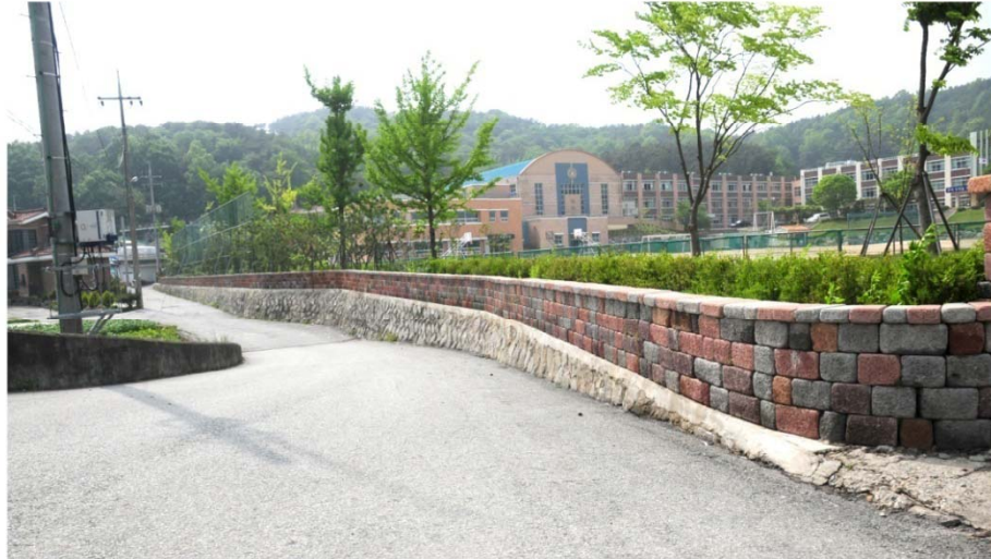
담장허물기로 소통의 장 ! 문화공간의 장 ! 제공

도심속의 부족한 녹지공간을 확보하여 시민들에게 휴식공간을 제공 하며 담장허물기 사업으로 폐쇄형 공간을 개방형으로 전환하여 시민들에게 친근한 공간조성 및 주민들과 소통의 장 으로 공간 제공