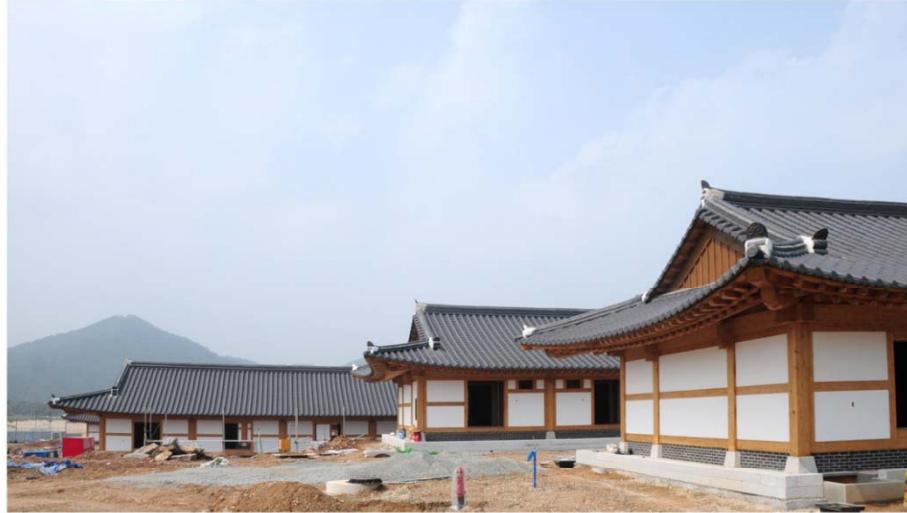
한옥의 획일성 보다는 다양함을 제공, 웰빙 효과도 제공하는 한옥숙박촌조성

박물관, 무령왕릉, 선화당, 공예공방촌, 숙박촌 등 인근 문화재와의 상호 연계로 역사, 문화, 교육프로그램 등의 확충 및 머무르며 쉬어갈수 있는 한옥숙박촌 조성