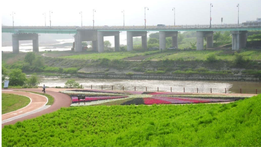
버려진 하천! 오염된 하천! 사랑받는 생태하천으로 태어나다

오염된 하천, 버려진 하천을 희망근로 일자리 창출 사업 등의 인력을 활용하여 자전거 도로 및 순환산책로를 조성하므로 시민들에게 휴식공간은 물론 청소년의 생태체험 학습장소로 활용