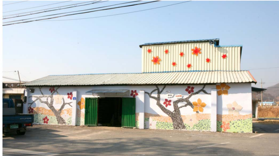
새롭게 단장한 중장리 예술마을

여러 작가의 작품 설치를 통해 문화 예술이 살아숨쉬는 마을로 조성 주민들의 공공 미술에 대한 친숙도를 높이고, 더 나아가 한번쯤 찾아오고 싶은 마을로 탈바꿈 하였습니다.