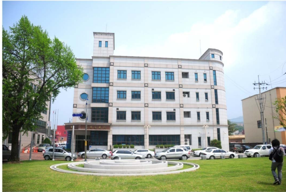
Gongju Culture Center

1954년 12월 16일 설립된 문화관광부 산하 비영리 문화 예술기관으로 공주지역의 문화 사업과 사회교육사업, 향토 문화연구 및 각종 행사 등을 시행하고 있음.