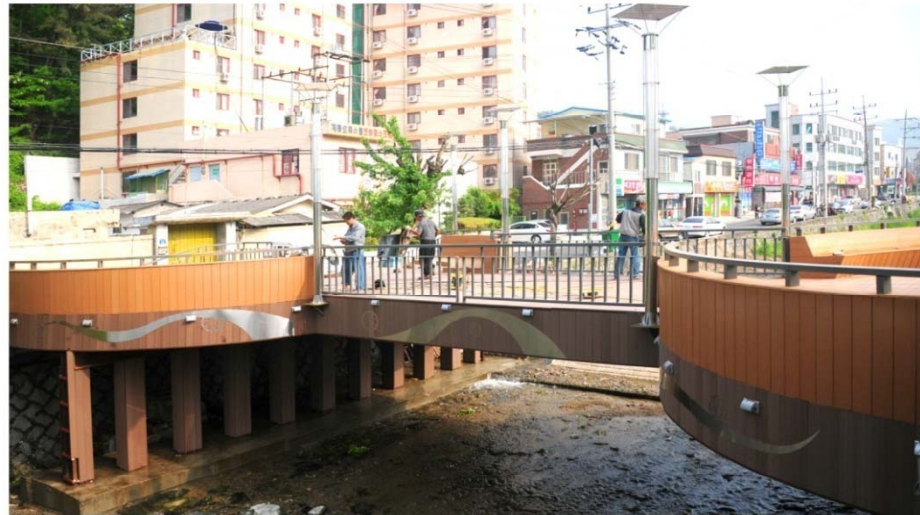
데크 교량 설치 / 편안한 쉼터 제공

공공디자인을 집목한 청의적인 데크 교량 설치로 시민과 관광객의 편안한 쉼터를 제공하므로 지역주민들의 소통의 장으로 활용