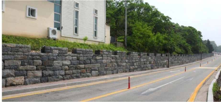
백제의 성 이미지를 살려 새롭게 태어난 무령왕릉길

2010 내백제전 개최 도시에 맞는 가로망을 정비하여 내방객과 시민에게 쾌적하고 편리한 명품 도로환경 제공