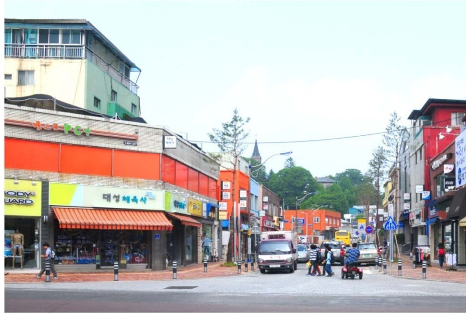
Culture street road

국고개지역의 환경개선사업을 통해 공주의 대표 역사가로를 개발하고, 가로시설물, 간판 등의 정비를 통해 주변 상업시설을 활성화 하여 걷고싶은거리로 연출