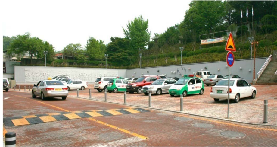
Culture street road

옥룡동 네거리 - 구 쌍화탕집에 이르는 1.2km 구간의 '겉고 싶은 명품 문화거리 조성사업' 중간 자락에 국고개의 역사를 설명한 효자 이복 부조 조각과 조형블록, 근대우물을 복원했고 광장 벽면에는 12개 동물과 12인물상으로 된 분수를 조성함으로써 공주를 찾는 관광객들의 이동 동선을 제민천과 도심으로 자연스럽게 유도합니다.