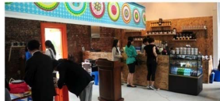
디자인 카페 _ 실내 1층 (구 읍사무소)