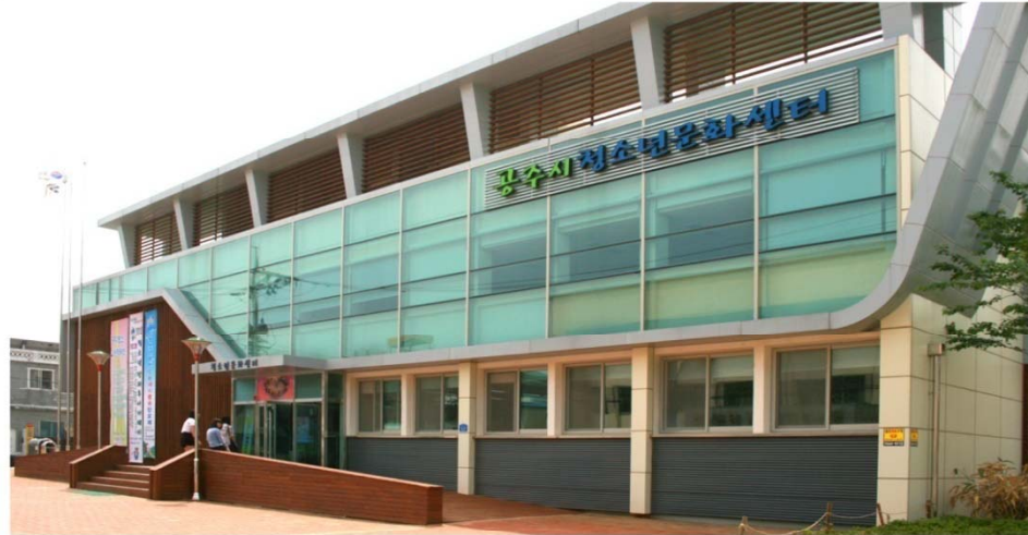
Culture Center for Teenagers

청소년들의 끼, 재능, 꿈을 건강하게 설계하고 마음껏 펼칠 수 있는 공간을 조성해 창조적인 문화의 장을 마련하였습니다.