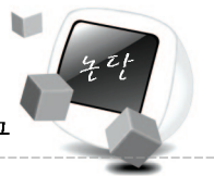
〈표 2〉 응답자의 속성