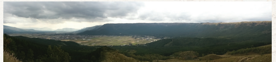
[사진 6] 전형적인 칼데라지형을 보여주는 아소시 전경

또한 일본은 오래전부터 임업이 발달해 왔고, 인공림이 잘 조성되어 있다. 그러나 90년대 이후 해외의 값싼 원목수입과 목재수요의 감소로 인해 임업이 쇠퇴하기 시작했다. 임업의 쇠퇴는 비단 임업만의 문제가 아니다. 적절한 산림관리가 되지 않으면 산사태 및 홍수로 이어져 재해의 문제로 직결이 되기 때문이다. 최근 큐슈에서는 폭우로 인한 산사태와 범람으로 인한 심각한 피해가 발생하기도 했다. 이와 같이 자연자원은 활용의 문제뿐만 아니라 재해예방에도 직결된다는 것이 포럼의 나카보 마코토(中坊 博) 사무국장의 생각이다.