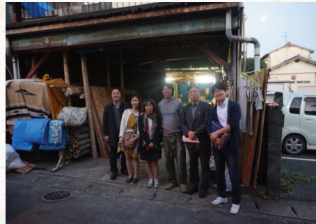
[사진 4] CHIKAKEN 공장