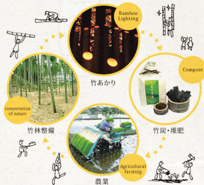
[그림 2] 대나무의 활용

CHIKAKEN의 활동은 환경문제를 제품으로 해결하는데 그치지 않고, 다양한 주체들과 연계협력하고 있다. 그 시발점은 역시 대나무 조명이다. 축제 등에 사용된 대나무조명은 화학처리를 하지 않기 때문에 일주일만 안 되어 썩기 시작한다. 그래서 축제 등에 사용된 대나무조명은 곧 쓰레기가 될 수밖에 없다. 그러나 쓰여진 대나무조명은 버려지지 않고 대나무 숲 및 대나무 비료로 재활용된다. 대나무 숲의 경우, 디자인된 숲으로 인기가 높고, 대나무 비료 역시 친환경비료로 인기가 높다. 이 사업은 CHIKAKEN이 직접 하지 않고 마을기업들과 연계해 추진한다. 이는 마을의 활력을 불어넣을 뿐만 아니라, 특히 고령자와 청년간의 세대 간 교류가 활발히 이루어지는 효과를 만들어 내고 있다.