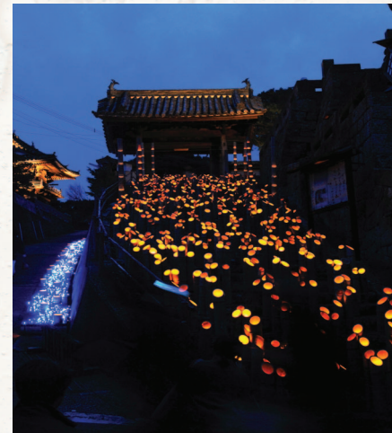
[사진 1] 우스키타케요이축제의 오브제

2만개 이상의 대나무가 사용되고 오브제 역시 30개 이상으로 도시 전체가 들쭉이는 규모로 발전하였다. 이러한 성공으로 인해 경제적 효과(연구에 따르면, 제4회 축제 개최 시점에서 4억엔 이상의 경제적 효과가 있었음)는 물론, 상점가 재생(16년간 150개정도의 새로운 가게가 생겨났음), 역사적으로 분단되어왔던 지역커뮤니티 재생, 고령자와 청년세대간 교류 활성화, 신규 관광객 증가 등 결과들을 얻었다. 이러한 성공은 규수의 다른 지역도 자극하였고, 다양한 등불축제들이 탄생한 계기가 되었다(상세한 소개는 다음 기회에 하기로 한다).