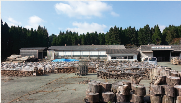
[사진 7] 아소산 중턱에 위치한 포럼의 장작 건조 시설

바이오매스를 둘러싼 다양한 이해관계자가 힘을 모아 적극적으로 활동을 하고 있다.