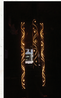
[사진 5] CHIKAKEN제품

CHIKAKEN의 활동은 환경문제를 제품으로 해결하는데 그치지 않고, 다양한 주체들과 연계협력하고 있다. 그 시발점은 역시 대나무 조명이다. 축제 등에 사용된 대나무조명은 화학처리를 하지 않기 때문에 일주일만 안 되어 썩기 시작한다. 그래서 축제 등에 사용된 대나무조명은 곧 쓰레기가 될 수밖에 없다. 그러나 쓰여진 대나무조명은 버려지지 않고 대나무 숲 및 대나무 비료로 재활용된다. 대나무 숲의 경우, 디자인된 숲으로 인기가 높고, 대나무 비료 역시 친환경비료로 인기가 높다. 이 사업은 CHIKAKEN이 직접 하지 않고 마을기업들과 연계해 추진한다. 이는 마을의 활력을 불어넣을 뿐만 아니라, 특히 고령자와 청년간의 세대 간 교류가 활발히 이루어지는 효과를 만들어 내고 있다.