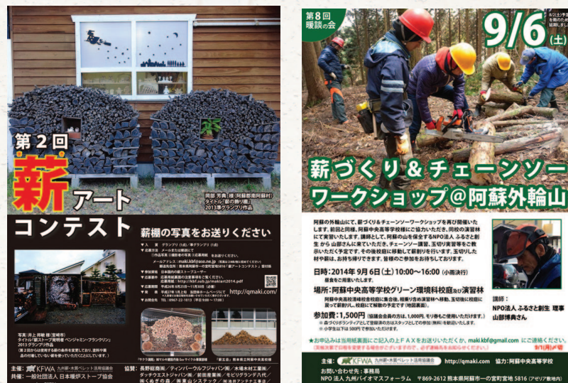
[그림 3] ‘장작 아트콘테스트’와 ‘장작만들기 워크숍’의 포스터

협약회의 활동은 일반인들에게 장작의 좋은 점을 알리는 한편, 장작에 대한 거부감을 없애기 위해 다양한 이벤트와 세미나, 워크숍을 개최한다. 예를 들어 장작만들기 워크숍 또는 장작아트콘테스트 등을 개최하여 일반인들에게 장작이 자주 노출되도록 노력하고 있다. 그리고 최근에는 일본 각지에서 추진하고 있는 나무정거장 사업도 적극적으로 검토하고 있다(‘나무정거장’에 대한 자세한 내용은 충남리포트 135호 참고).