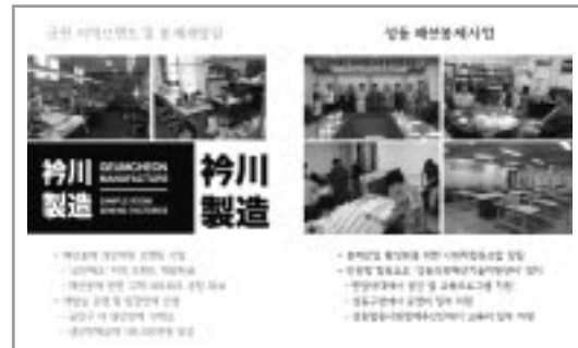
〈그림 1〉 서울형 제조업 밀집지역내 사회적경제 연계 사례

또한 자립기반 조성을 위한 통합적 경영지원 체계를 마련해 나가고 있다. 자본조달 측면에서 는 5백억원 규모의 서울시 사회투자기금 운용 외에 서울신용보증재단과 연계한 사회적경제 특 별보증제를 도입하였다. 창업기에 집중되었던 지원정책을 기업생애주기별 맞춤형 경영지원으 로 전환중인데, 서울시 사회적경제 인재양성을 위한 로드맵 개발과 액션러닝형 교과과정 20종 개발 보급, 우수 사업체의 확산을 위한 쇼셜프 랜차이즈 매뉴얼 개발, 서울시 사회적경제의 생 산물을 패키징한 도시형꾸러미 '햇음' 및 광화 문 광장을 개방한 시민장터 운영과 자치구별 공 유장비 지원, , 공공기관의 구매 수요 및 공급역 량 조사와 판로촉진을 위한 공동영업단 등을 운 영중이다.