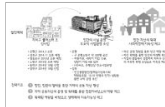
〈그림 3〉 서울시 사회적경제 공유자산 형성 지원 : 사회적경제클러스터 조성 지원

마지막으로 커뮤니티 자산 조성 및 공공자산 활용전략은 충남에서도 꼭 추진해보기를 기대하 는 신전략사업이다. 영국의 로컬리티 등이 주력 하고 있는 유희 공공자산의 지역시민 경영 즉, 자산화전략은 사회적경제가 사회적 가치를 지속 하면서 발생하는 수익성 감소문제를 해결하면서 동시에 커뮤니티가 계속 이용 가능한 공유자산 을 만든다는 점에서 필히 도입될 필요가 있는 지원전략이다. 이에 서울시에서는 지자체가 보 유한 유희 부지나 건물에 대해 사회적경제클러 스터로 조성하는 경우, 리모델링 비용을 지원하 고 사회적경제네트워크가 운영권을 행사하도록 돕는 사업을 추진하기 시작하였다. 현재까지 은 평 · 성북이 개장하였고 영등포 · 노원 · 양천 · 동 작 등이 공사중에 있다.