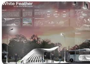
[ 2012 대상]