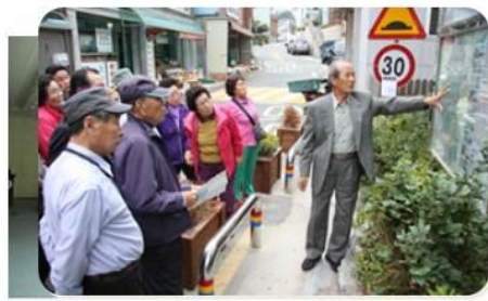
공공디자인 강의실 전경]