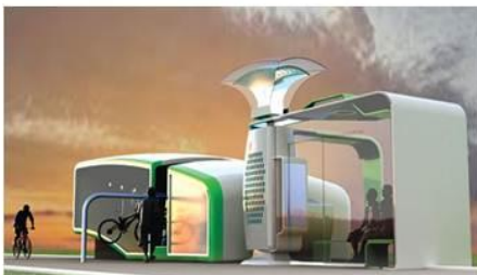
[ 2013 대상]