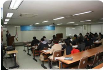
경주 양동마을 현장 견학