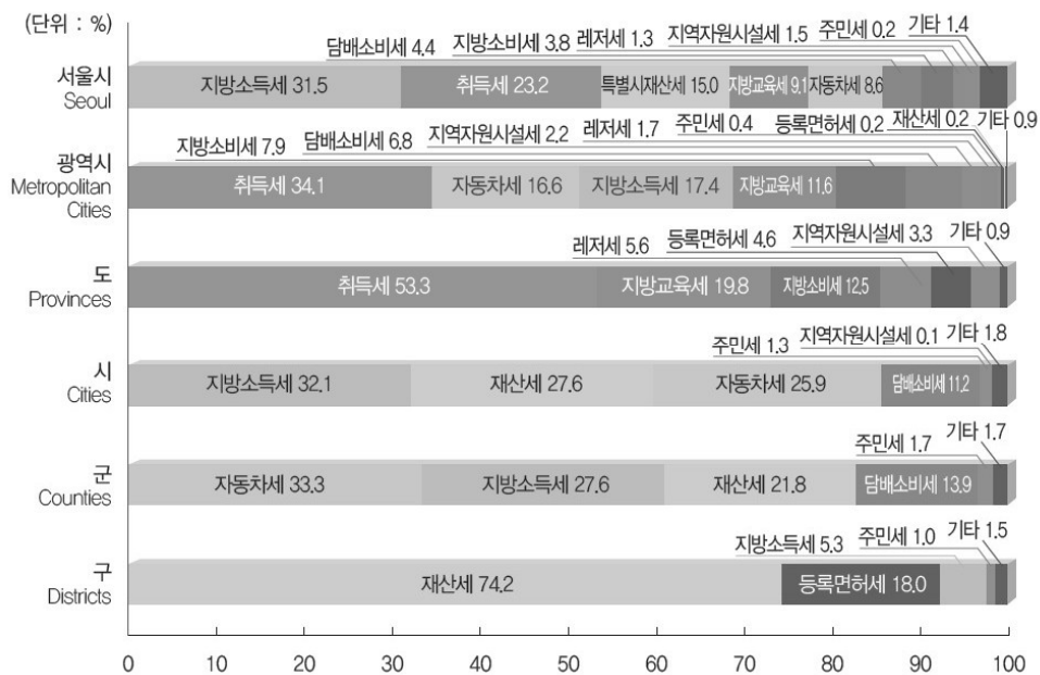
〈그림 2〉 지방자치단체 유형별 지방세 세목별 구성비율(2012)