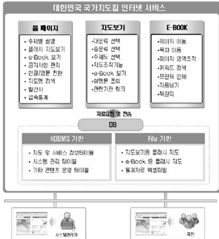
그림 2.3 국가지도집 E-Atlas의 서비스 목록