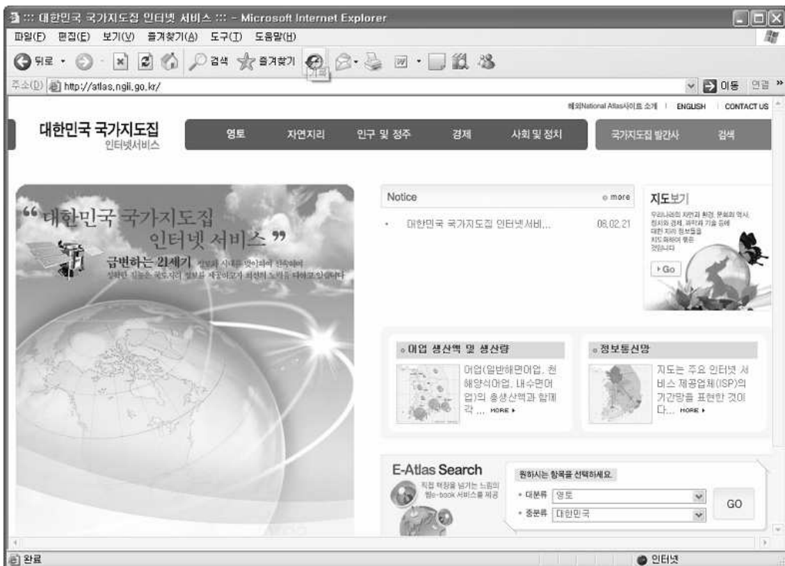
그림 2.4 국가 지도집 E-Atlas 홈페이지

제작하여 개별단위로 서비스 하고 있다. 대부분의 경우 국가지도집 출판에 사용되었던 지도 일러스트파일을 이용, 벡터형식의 플래시지도를 제작하여 e-Book에 비해 보다 선명한 화면을 제공하여 가시성을 높였다. 그리하여 e-Book과 플래시지도서비스가 상호보완적이 되도록 하였다. 전자는 발간된 대한민국 국가지도집의 충실한 전달에 중점을 두며, 후자는 가시성 확보 이외에도 분류별 지도찾기, 지도별 설명문 조회, 통계자료 제공 등 사용이 편한 메뉴구조, 지도별 단위 서비스에 중점을 두었다.