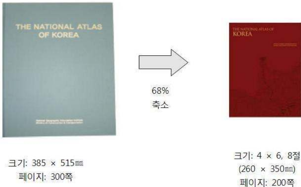
그림 2.2 대한민국 국가지도집과 국가지도집 영문축소보급판 책자 발간 규격 비교