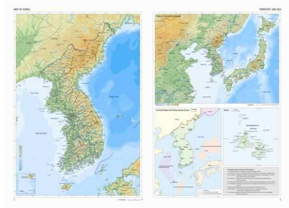
그림 2.1 대한민국국가지도집