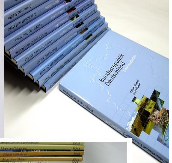
선진국형 다권 국가지도집 모형 (프랑스, 독일, 스웨덴)