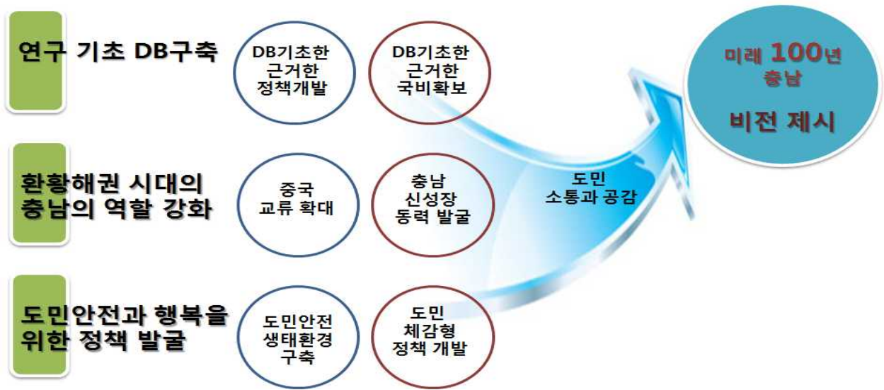
[ 미래정책 연구 기본 방향 ]