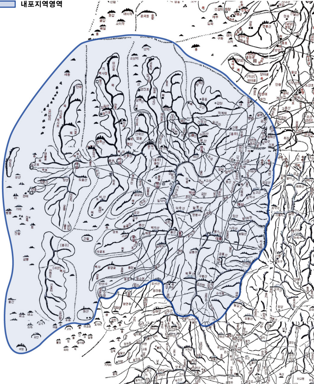
〈그림 2〉 대동여지도 중 내포지역