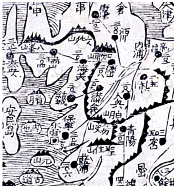
〈그림 1〉 김정호가 “태극을 다투는 대길지”라 한 내포지역