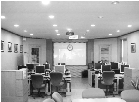
백미리마을 정보화마을 교육장