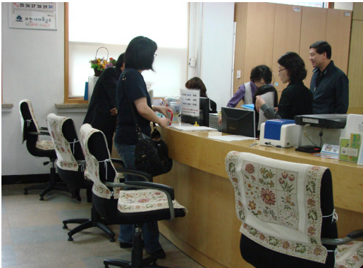
<그림 4> 공공기관 민원실의 장벽

⇒ 유니버설디자인의 개념을 적용하여 출산과 보육여건이 조성된 도시 및 건축주거 공간조성