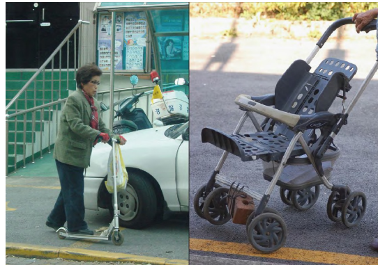
<그림 5> 보행공간 협소