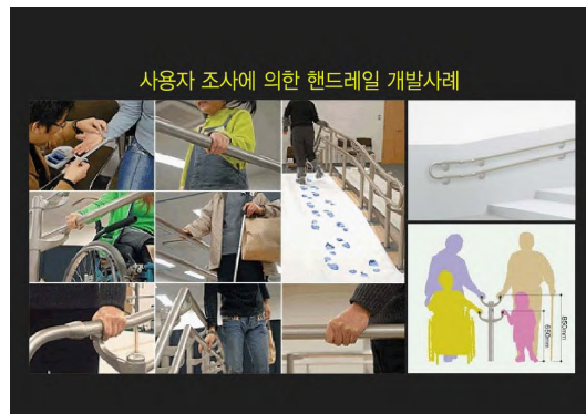
<그림 2> 사용자 중심의 핸드레일