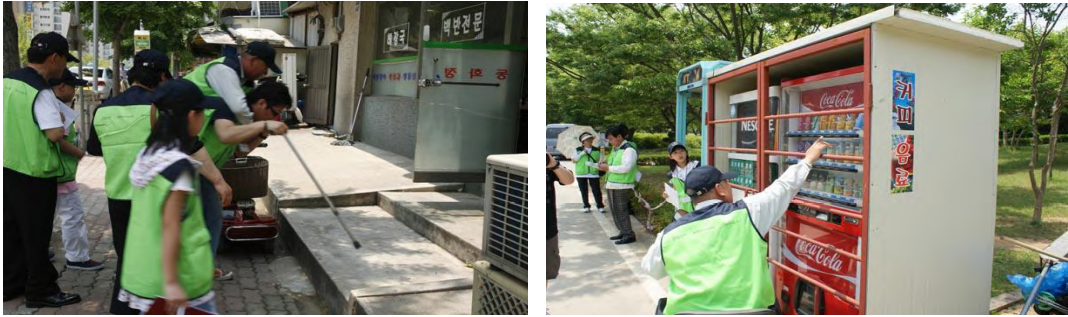
<그림 3> 생활주변의 장애요소