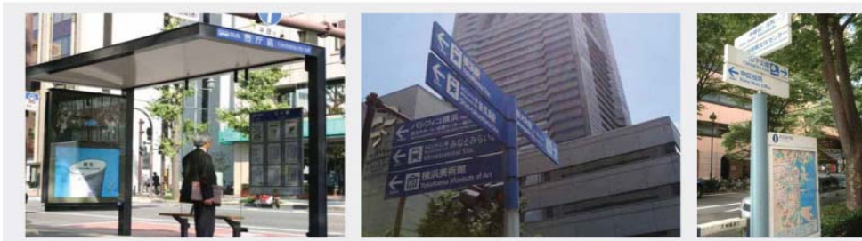
<그림 3> 요코하마도시 디자인 개선사례

경관과 조화를 고려, 알기쉽고 심플한 사인연출 통합사인시스템으로 깔끔한 도시이미지 연출