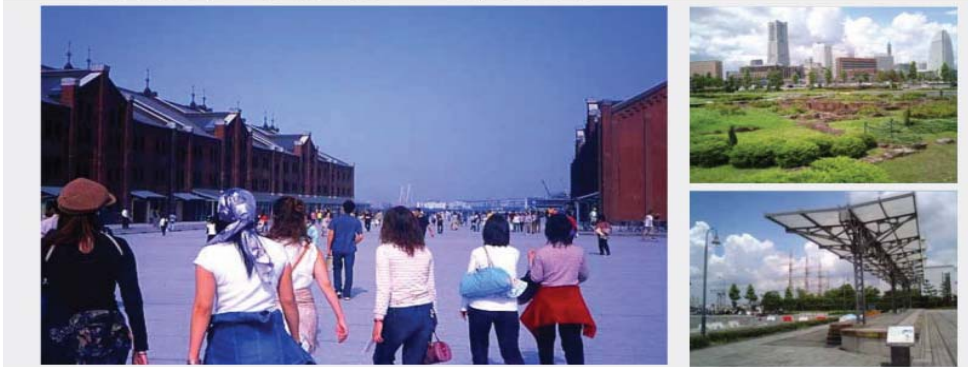
<그림 4> 요코하마 미나토미라이 21지구 도시 디자인 개선사례