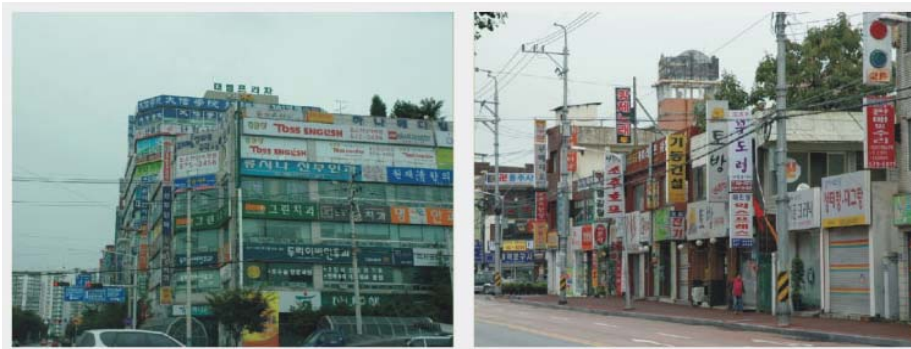
<그림 5> 무질서한 간판사례