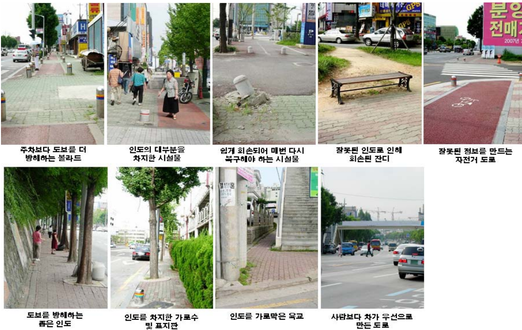
<그림 6> 가로환경시설물 설치 현황 및 훼손사례