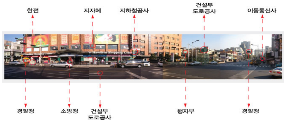
<그림 7> 가로시설물의 관리주체