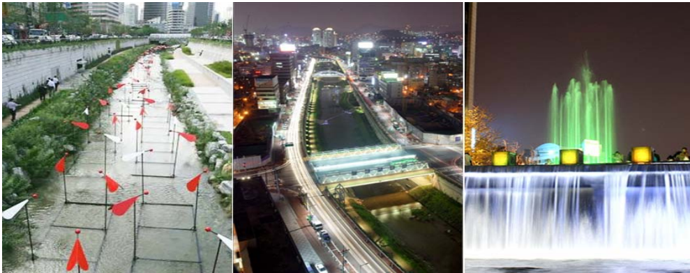
<그림2> 공공디자인 개선사례(서울 청계천)