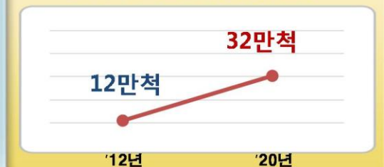
중국 레저선박 생산량 전망