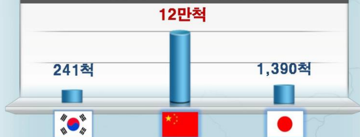
레저선박 해외수출 현황('12)