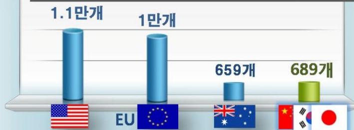
권역별 마리나항만 현황('12)