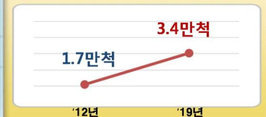
크로아티아 마리나 시설 확충 전망