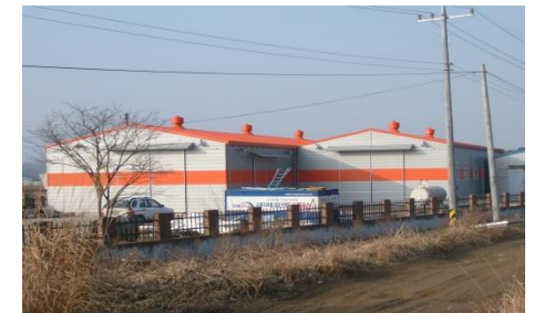
▶ 장항수산물 산지가공시설지원 (멸치 산지가공시설)