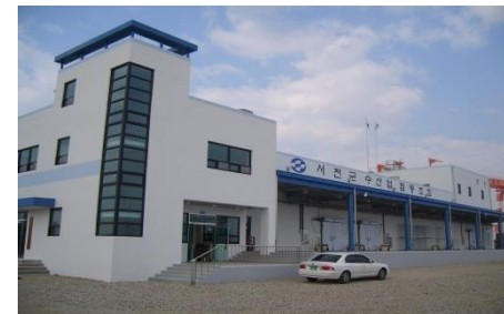
▶ 장항수산물 처리저장시설