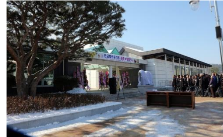
▶ 장항선 폐선활용 관광진흥사업 (판교특화음식촌)