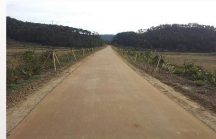
▶ 장항선 폐선부지 선로변 경관조성 (자전거 도로)