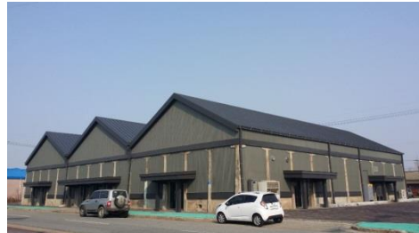
▶ 장항선 폐선활용 관광진흥사업 (미곡창고 생활문화창작공간)