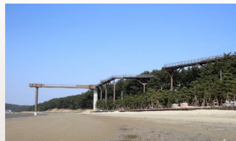
▶ 장항선 폐선활용 관광진흥사업 (송림어뮤즈 스카이워크)