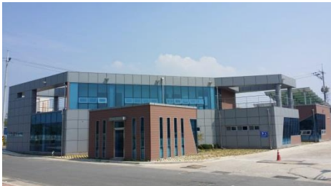
▶ 장항선 폐선활용 관광진흥사업 (방문자 숙소사업)