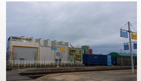
▶ 장항선 폐선활용 관광진흥사업 (미디어센터)