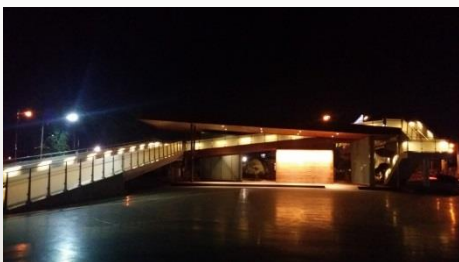
▶ 장항선 폐선활용 관광진흥사업 (선셋수변 랜드마크(육교))