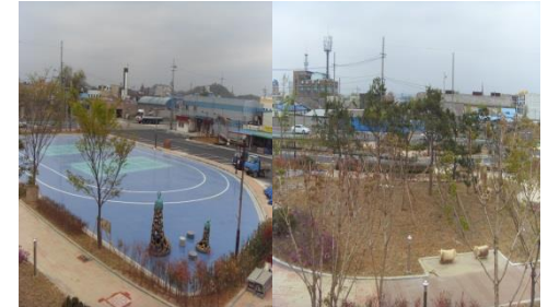
▶ 장항도선장 해상기반시설 확충 (운동시설 및 소공원)