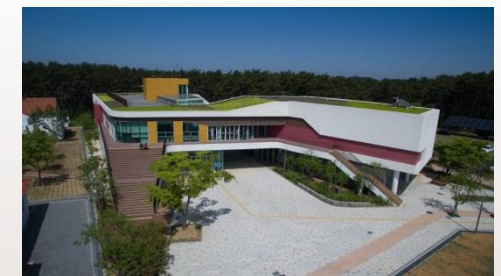
▶ 서천군 청소년수련관 건립