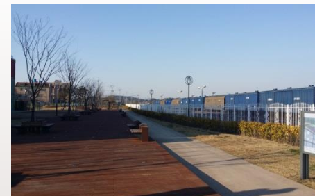
▶ 장항선 폐선활용 관광진흥사업 (문화관광공원)