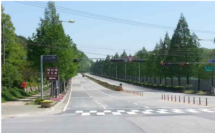
• 염선재 입구~IC, 통과시 언덕길 시야 펼쳐짐