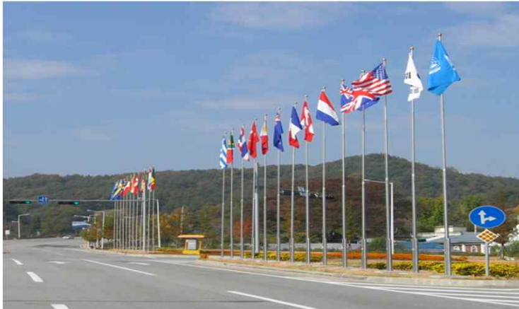
• (IC 입구) 한국전쟁 참전국·지원국 국기게양대