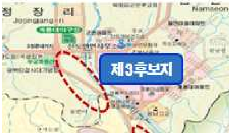
• (계룡대 지역) 직선도로, 좌우측