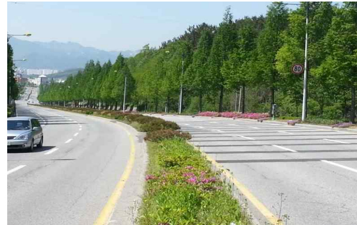
• (시내방향) 낮은 언덕길로 좌우측 간 균형 유지