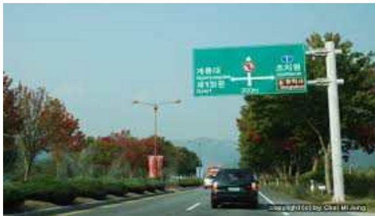
• 계룡대 지역 초입 도로중앙 가로등 설치