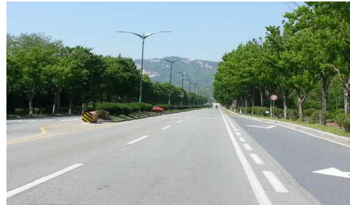
• (계룡대 방향) 계룡대 지역 도로중앙 군 사용