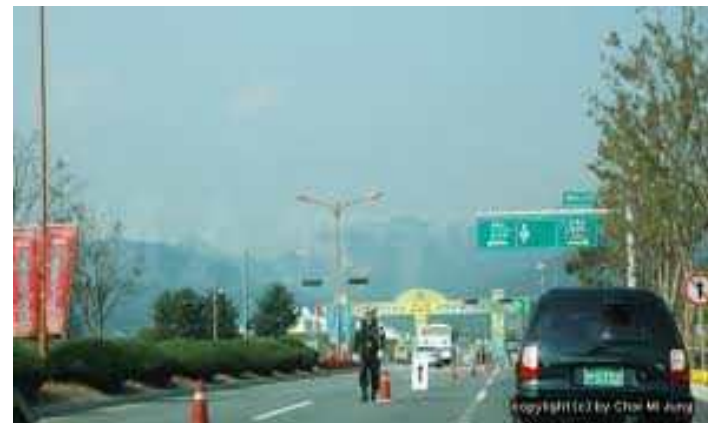
• 계룡군문화 축제 관련 비상활주로 입구지역