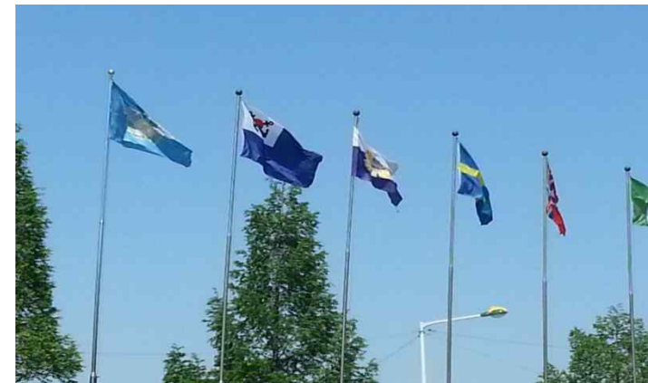
• 참전지원국 국기게양대 우측 육·해·공군기 게양