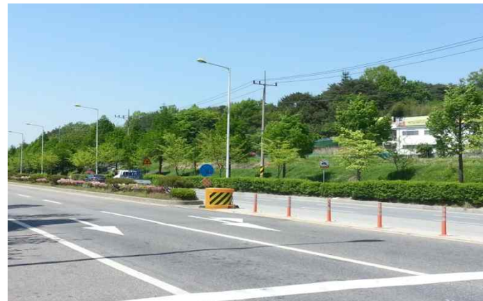
• (IC방향) 염선재 반대편 우측 휴식공간 확보