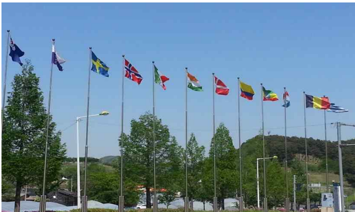
• (IC 입구) 한국전쟁 참전 지원국 국기게양대