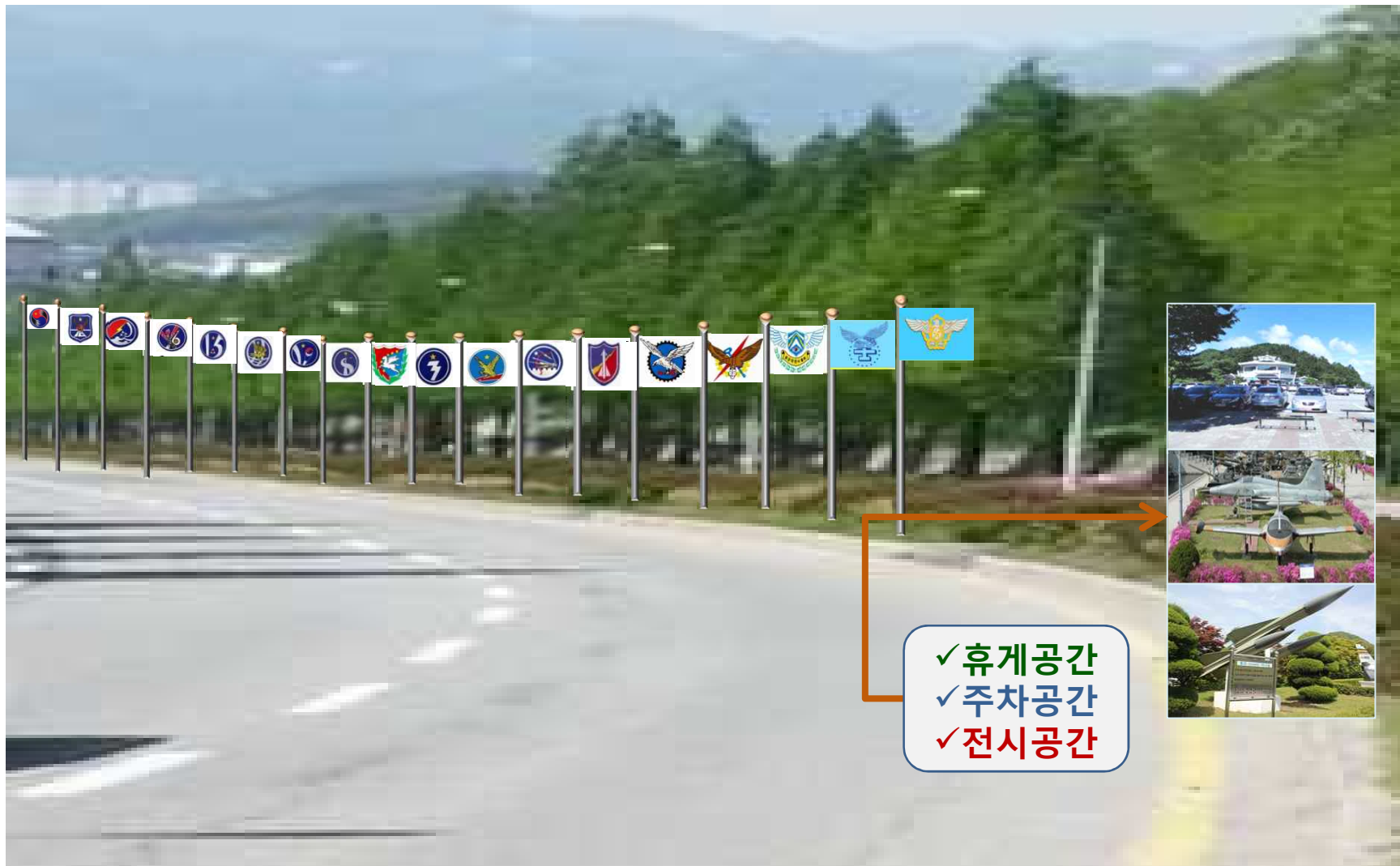
「공군의 거리」 (예시)