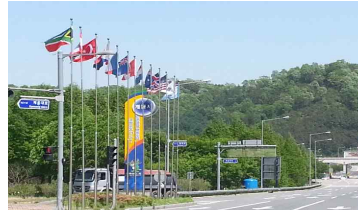
• (IC 입구) 한국전쟁 참전국 국기게양대