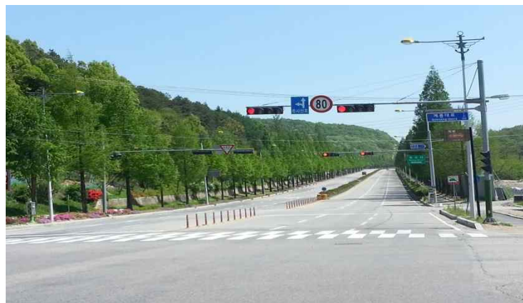
• (IC방향) 수려한 경관, 좌우측 장애물 없음