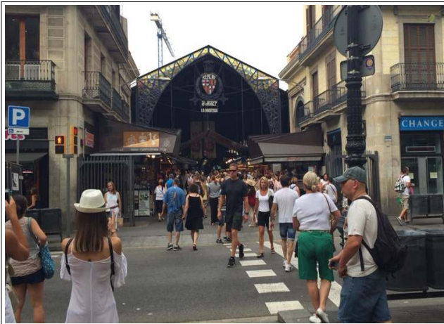
<전 면 1>