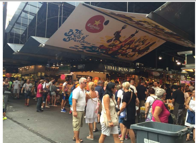
<전 면 2>