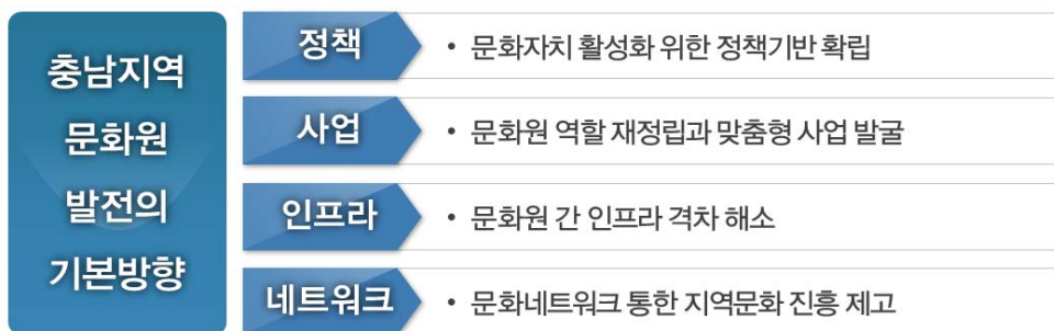
[그림 2] 충남지역 문화원 발전의 기본 방향