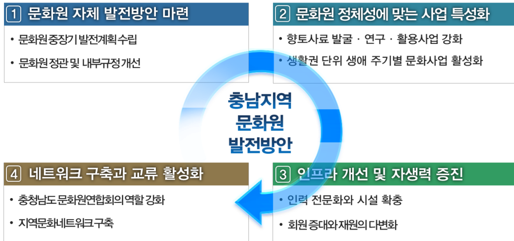
[그림 4] 충남 지방문화원 발전방안