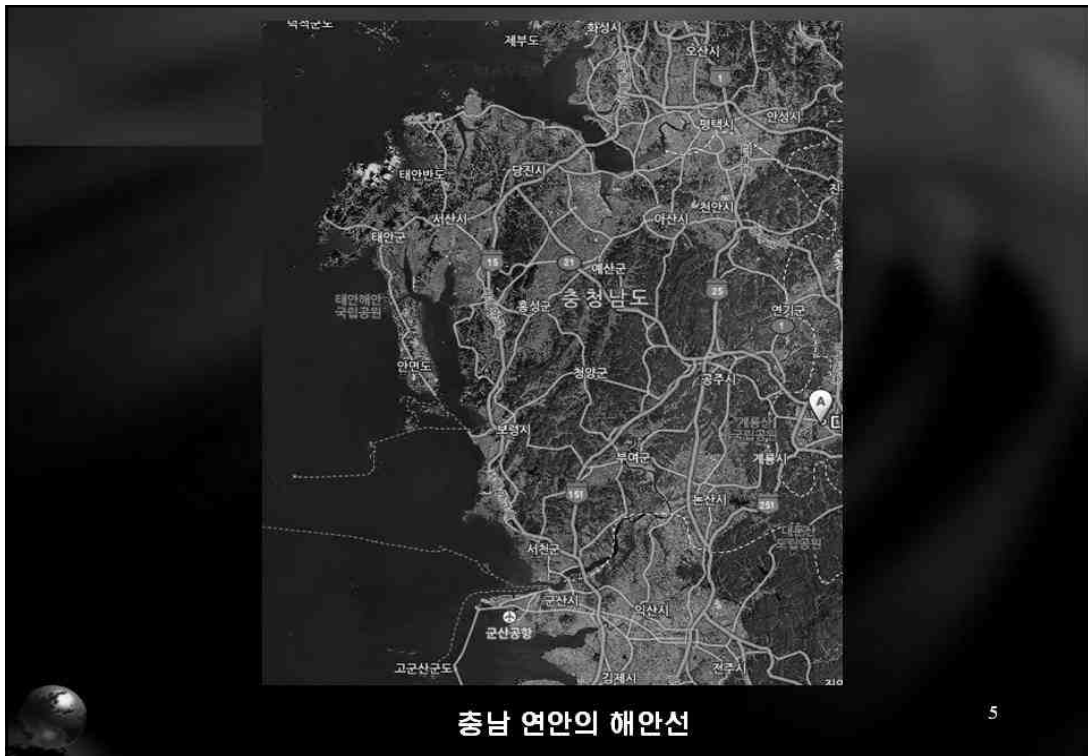
충남 연안의 해안선