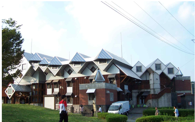
● 오구니마치 목훈관