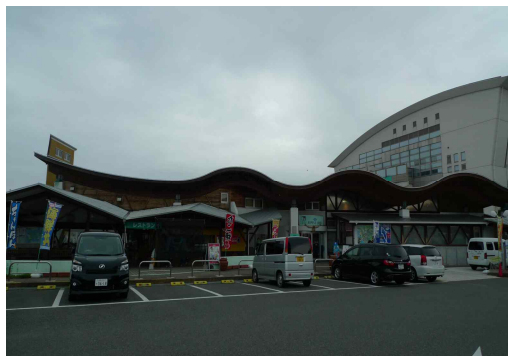
●건물의 곡선 전체형태