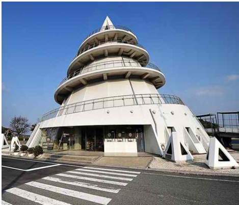
● 웨리터미널 (바다의 피라밋)

소라를 모티브로 만들어진 미스미항 페리 터미널인 바다의 피라미드는 구마모토 아트폴리스 출품작이기도 한 항구의 랜드마크