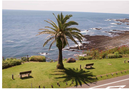
● 미찌노에키 상징- 피닉스