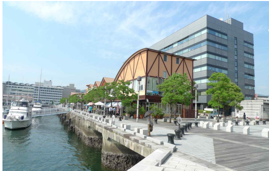
● 해안경관 조망성 양호