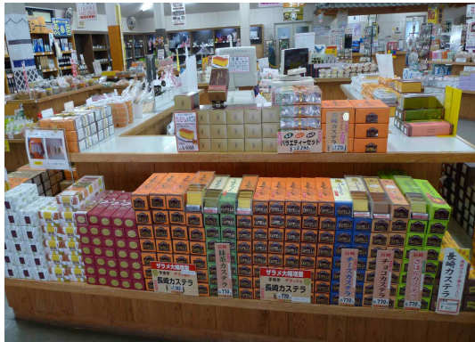
• 농특산품 가공상품