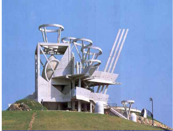
● 구마모토 다마나 전망관