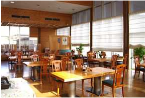
• 레스토랑 내부