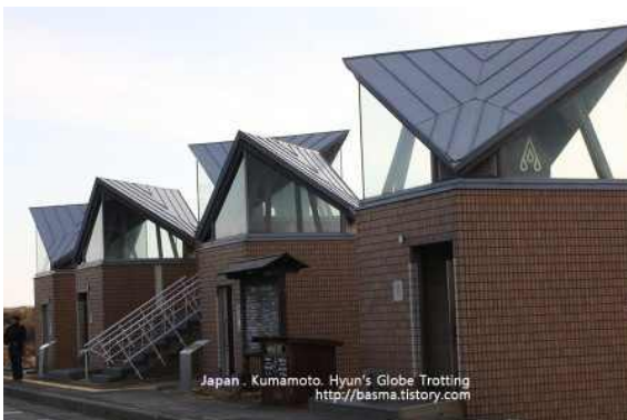
● 아소산 공중화장실