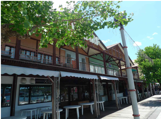
● 데지마 워프 워터후론트 건물