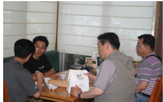
• 관리자 면담