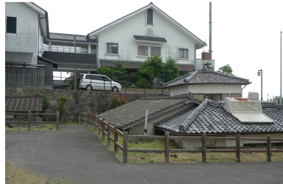
● 토석류 피해 가옥 보존공원