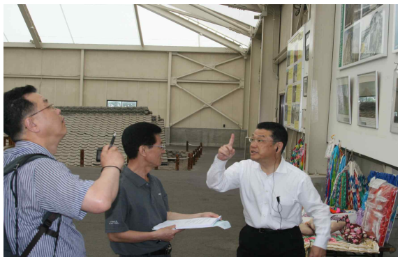
● 토석류 피해 가옥 전시관