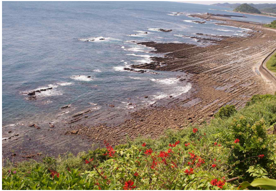
● 도깨비 빨래판 형태의 파상암