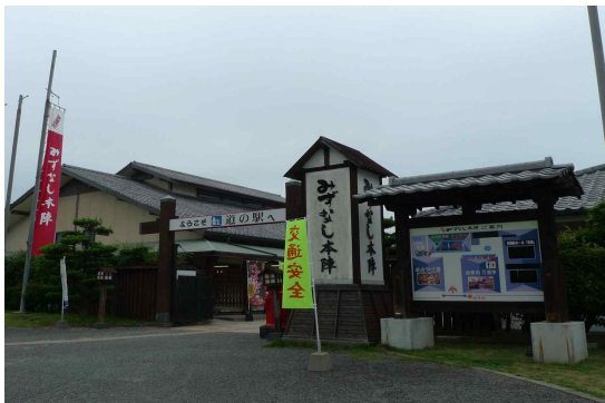
● 미즈나시혼진후카 입구 - 게이트