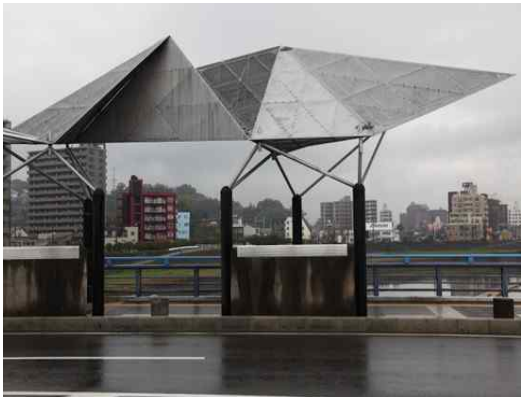
● 시라카오교 상판디자인