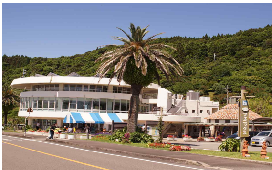
● 미찌노에키 피닉스