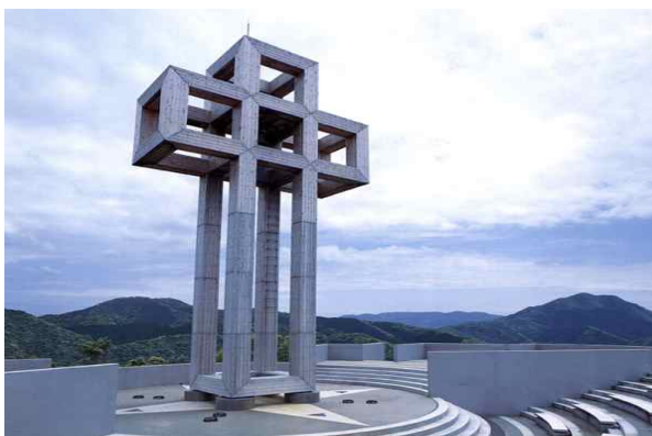
● 아마쿠사- 채플의 종 전망공원