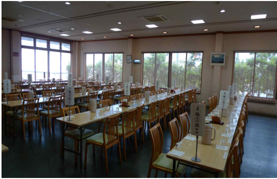
● 레스토랑 내부