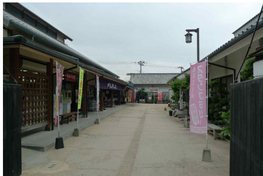
● 혼진 후카에 내부 - 개방성