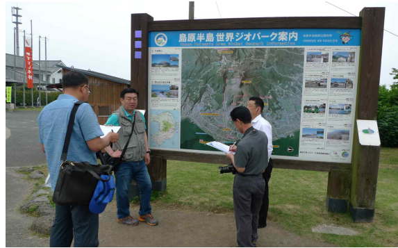
● 운젠화산피해지역 안내