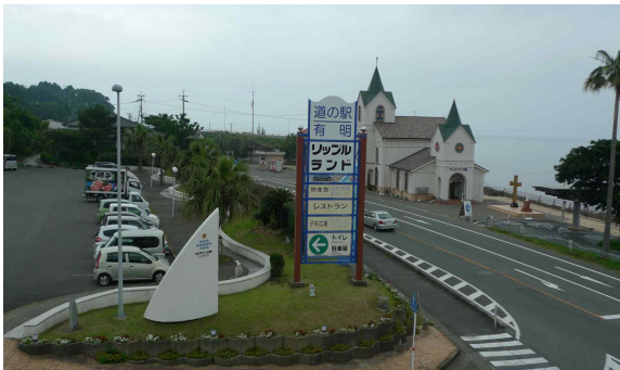
●아리아케 리플랜드 안내사인