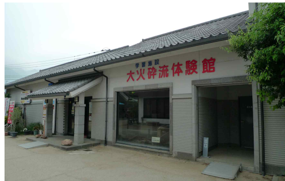
● 화산 체험관