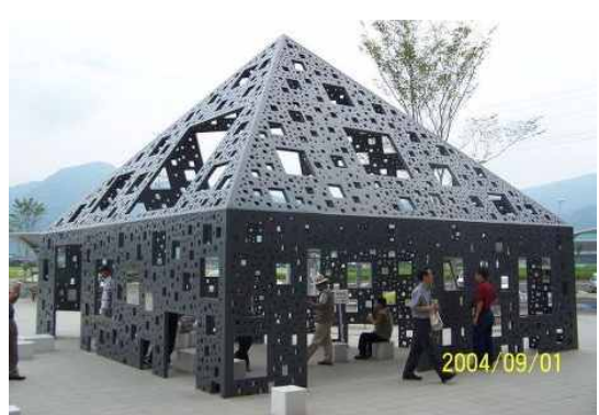
● 신야쓰시로역 앞 모뉴먼트