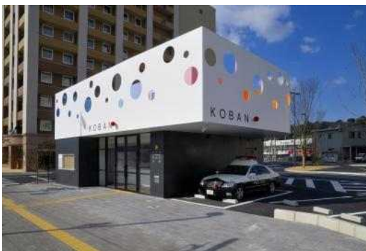
● 구마모토역 파출소