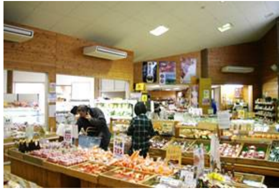
• 농특산물 판매장