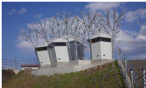
● 시라카와 좌측강변 공중화장실