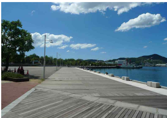
● 데지마 워프 워터프론트 데크