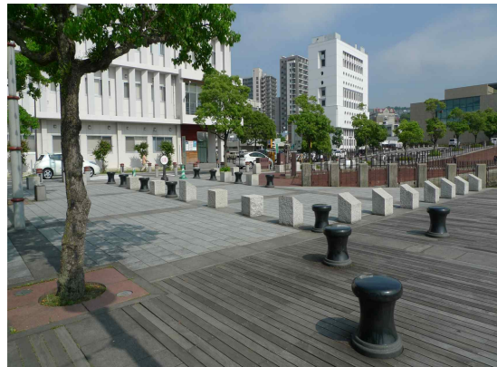
● 해안벤치 시설물