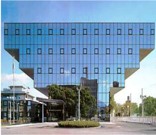
● 구마모토기타 경찰서