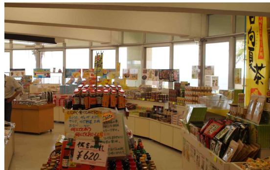
● 미찌노에키 농산물 판매장