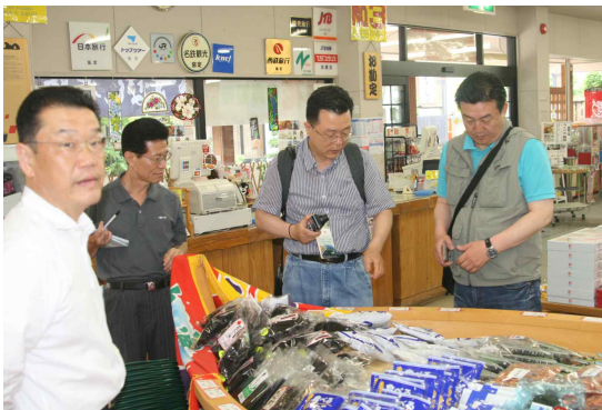
● 농산물 판매장