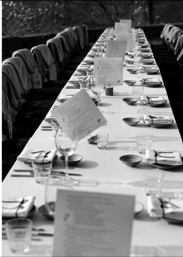
기본 테이블 세팅 목련이 만발 한 야외에서 진행