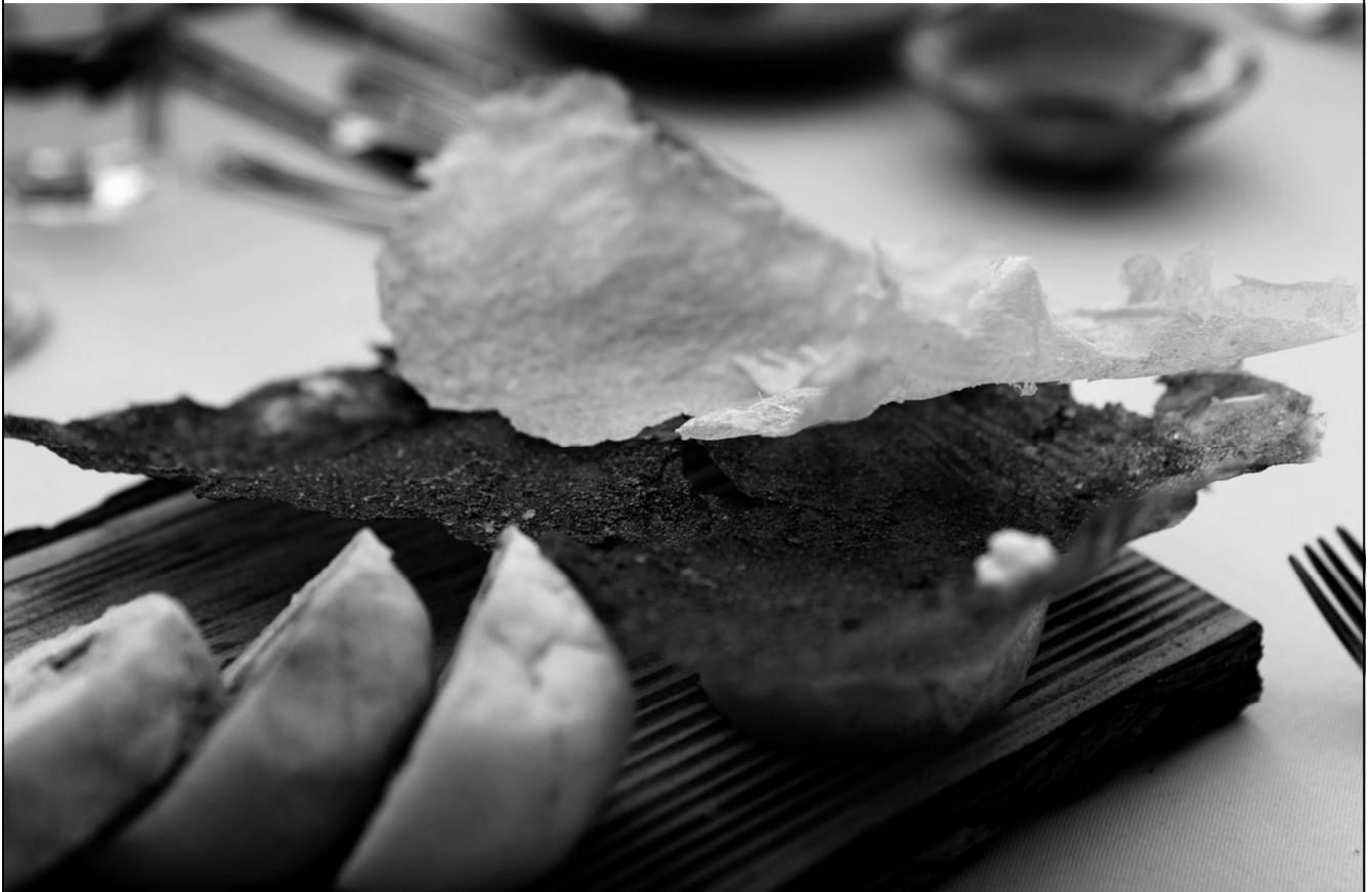
트러플 마스카포네 치즈와 논산 쌀 튀일