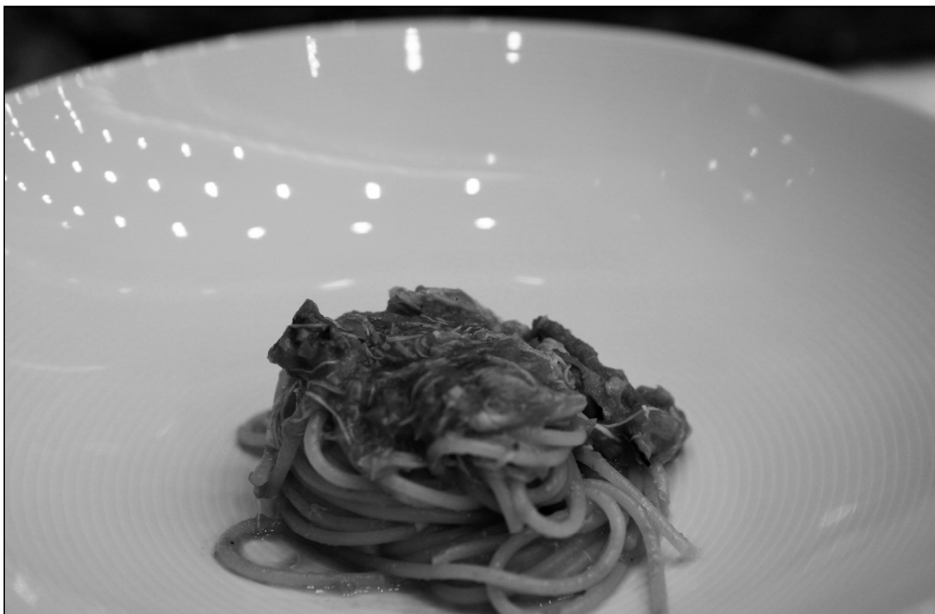
채석포 암꽃게 로제소스 스파게티니