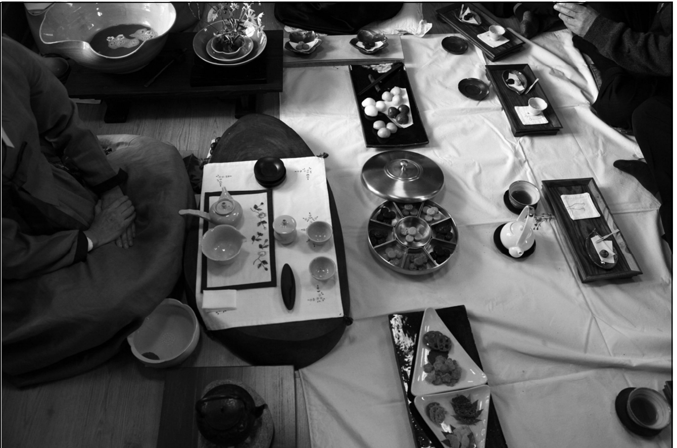
태안 재료를 이용한 식전 찾자리