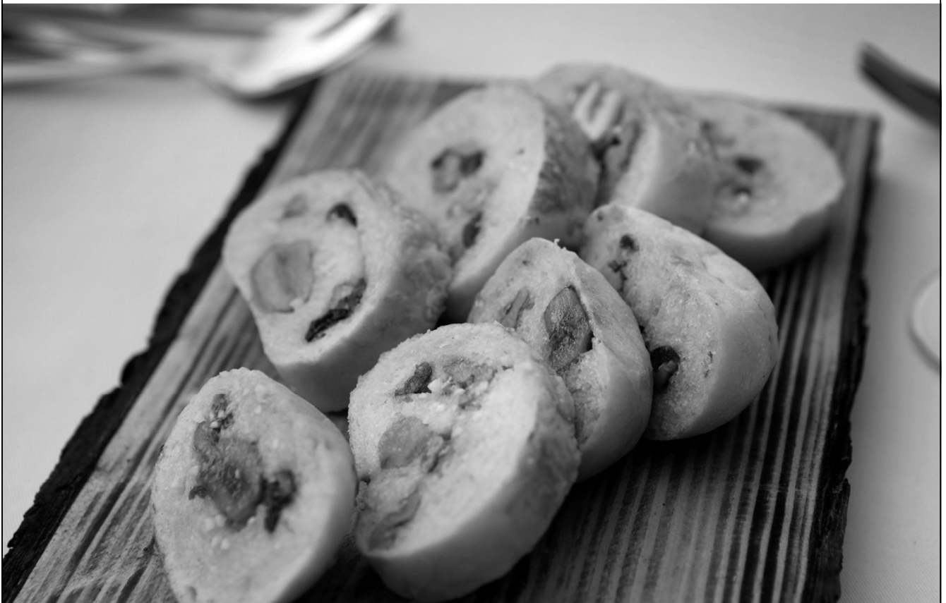
천안 호두와 공주 밤으로 속을 채운 청양감자 빵