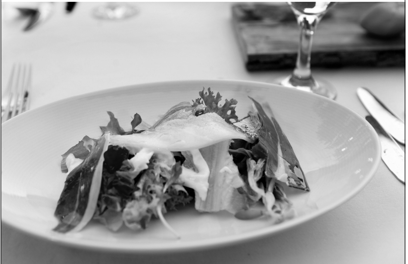
충남 봄 샐러드