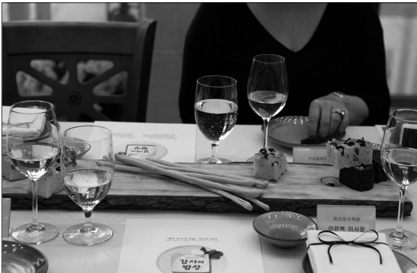
가운데 소나무빵접시는 안면도 소나무 사용, 와인 마리아주 곁들임