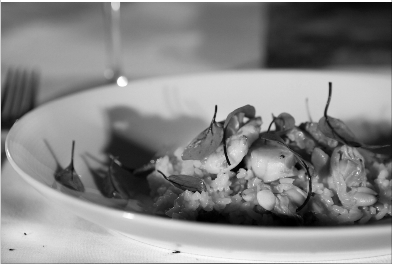
태안반도 빠에야 (주꾸미, 가리비, 새우, 담치, 바지락, 사프란)