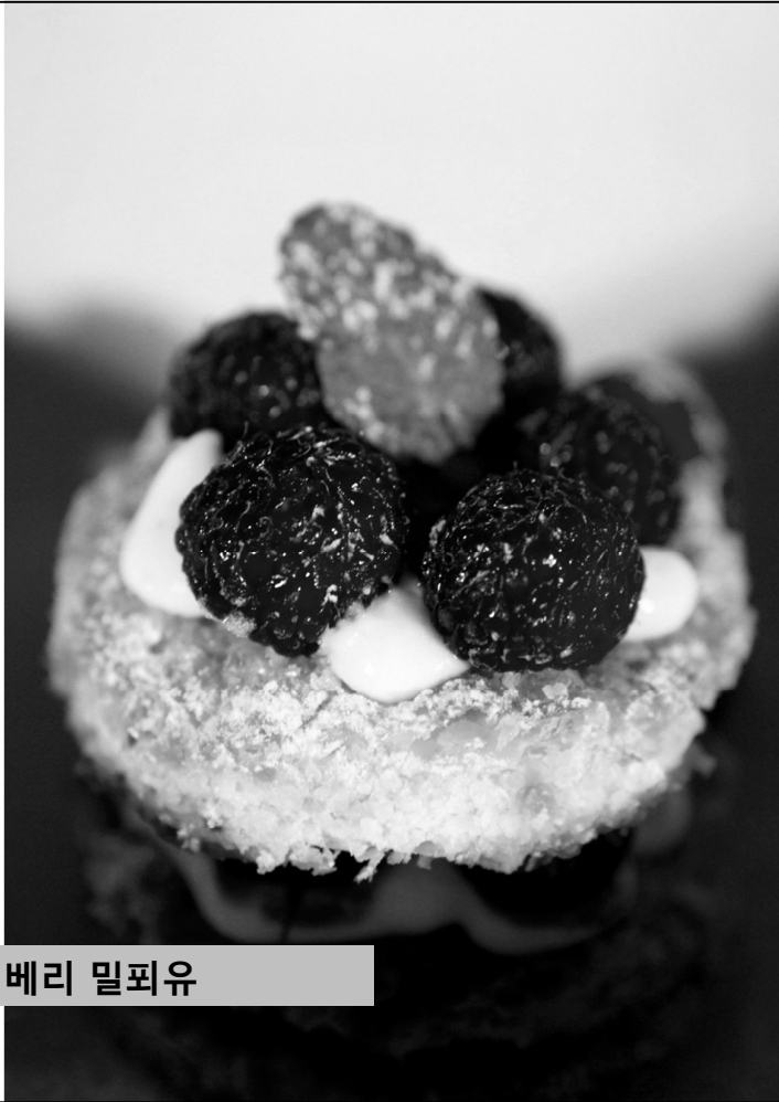
디저트 : 3가지 베리 밀푼유