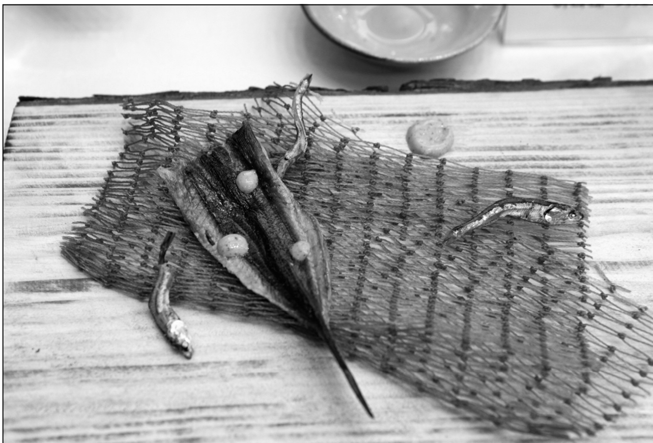
요거트와 승언리 갯바람 고추장소스를 곁들인 천리포 까나리와 망둥어