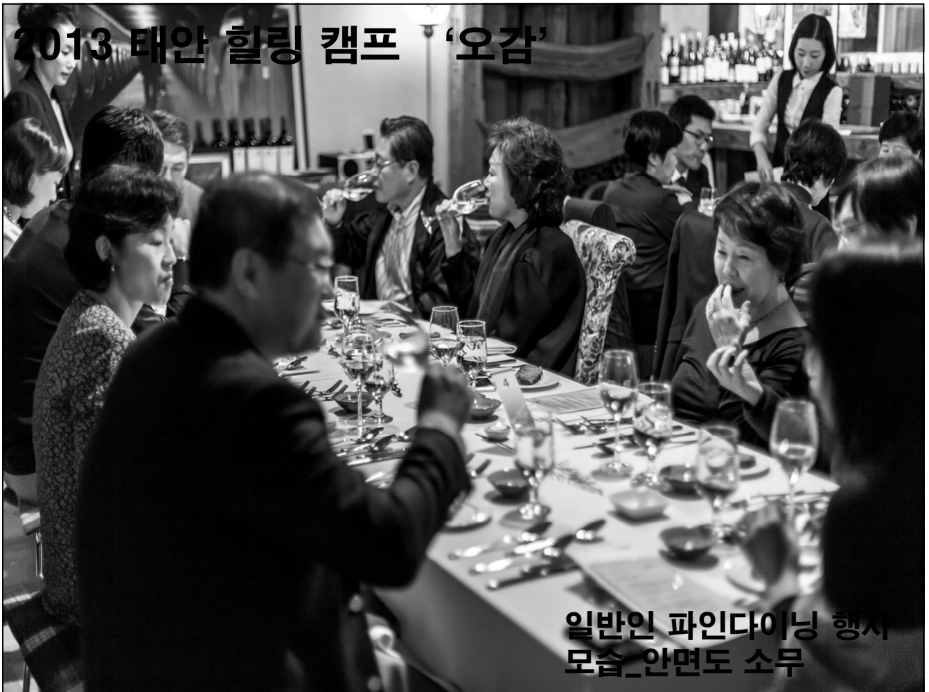
일반인 파인다이닝 행사 모습_안면도 소무