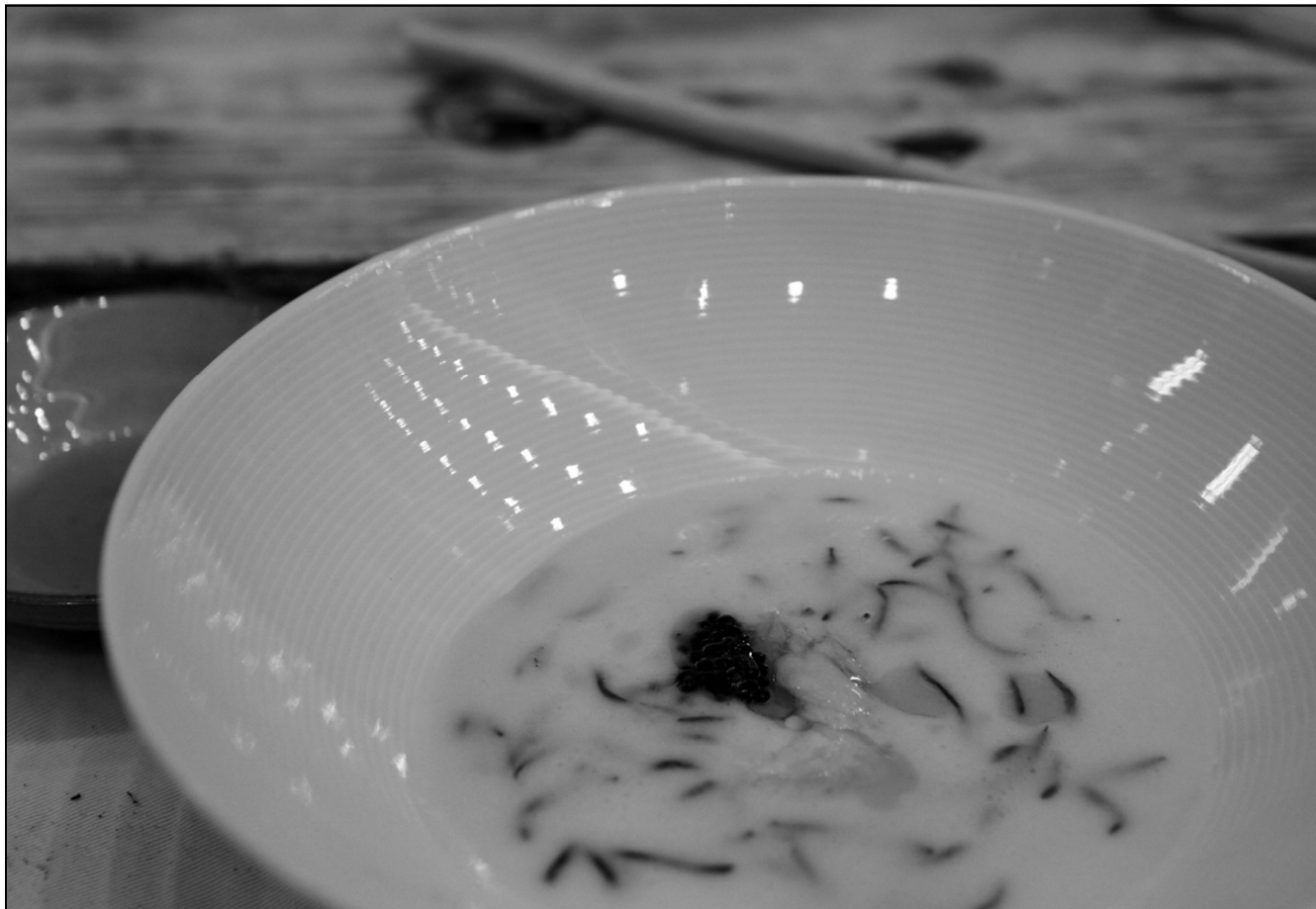
청어알을 곁들인 영목항 물텀병이와 남면 가시리 벨루떼