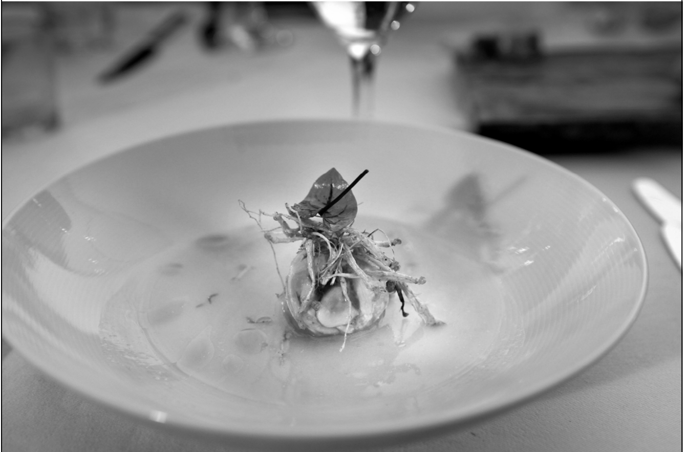
프렌치 스타일 삼계탕 (장뇌삼, 대추, 마늘, 영계, 밤, 생강)