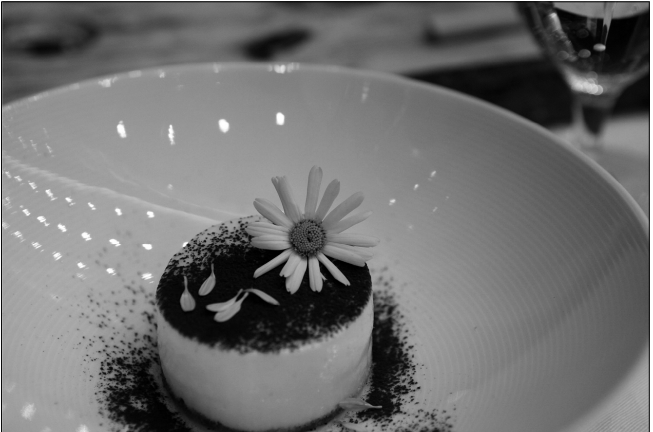
천리포수목원 가을국화꽃과 티라미슈

충남의 바다와 산, 들을 품다 목련꽃 그늘아래_생명의 밥상 2013_05_04