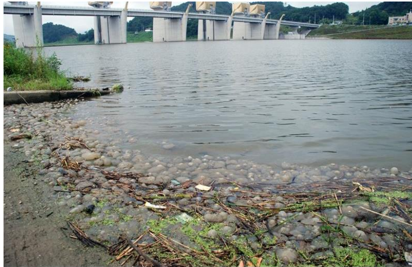
공주보 상류 큰빛이끼벌레 집단 폐사 현장(2014)