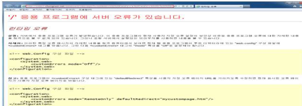
[그림 3-1] 부적절한 에러 메시지 1

http://water2.chungnam.net/databoard/view.aspx?t=not&idx=193%5B'and'a'='a,%20'and'a'='b%5D,%20%5Band%201=1,%20and%201=2%5D