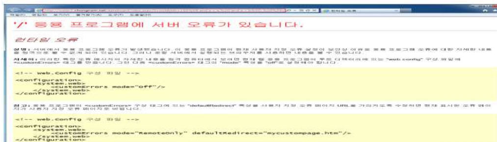
[그림 3-2] 부적절한 에러 메시지 2

http://water.chungnam.net/search/search1.aspx?t=2