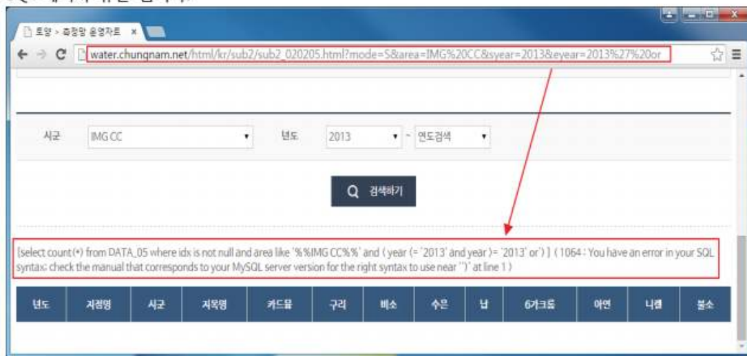
[그림 3-1] SQL Injection 시도

'eyear' 파라미터에 SQL 에러를 유발 할 수 있는 " ' or " 특수 문자를 삽입하여 서버로 전송 시 SQL 에러가 유발 됩니다.