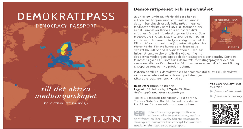
〈그림 1〉 스웨덴 팔룬시 민주주의 패스포트