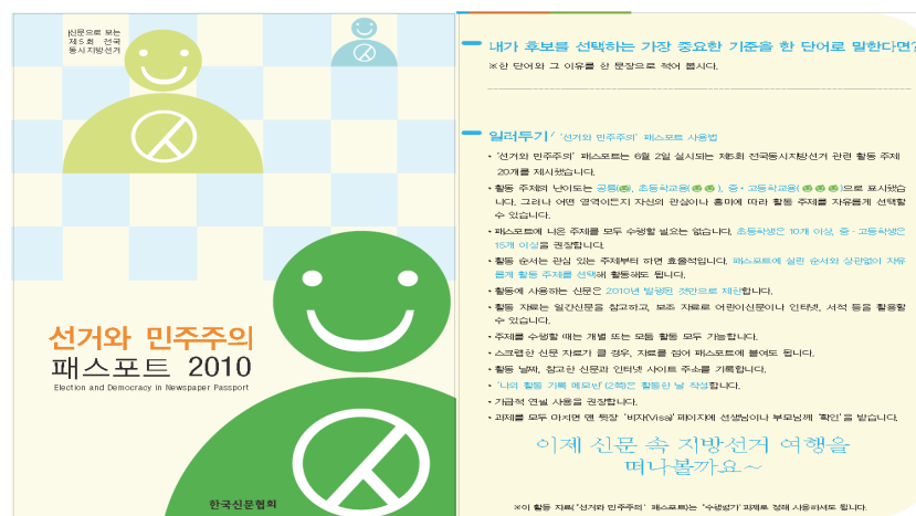
〈그림 3〉 선거와 민주주의 패스포트 2010 표지 및 사용법