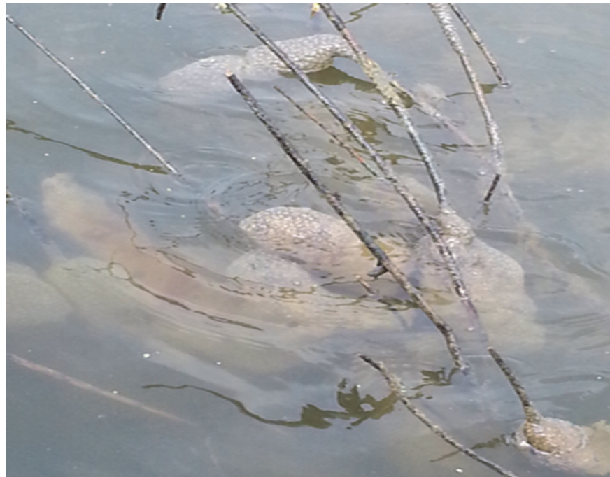
〈그림 1〉 금강의 큰빛이끼벌레 서식 모습