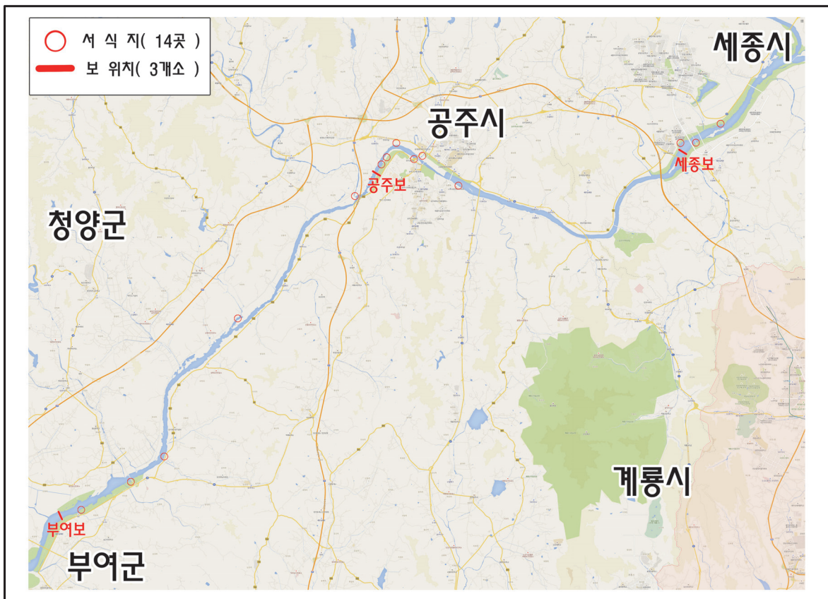
〈그림 2〉 금강 본류구간 큰빛이끼벌레 서식지 현황