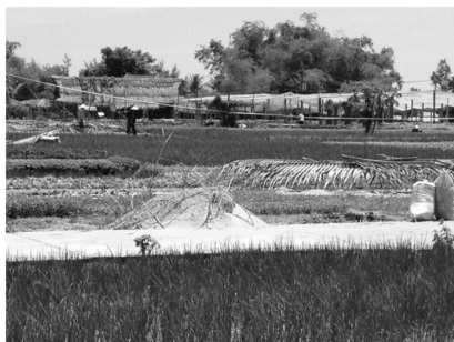
베트남 호이안의 투어리즘