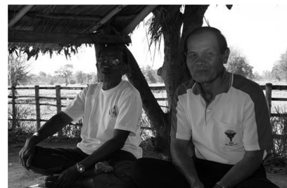
동북태국 전통농업으로의 복귀