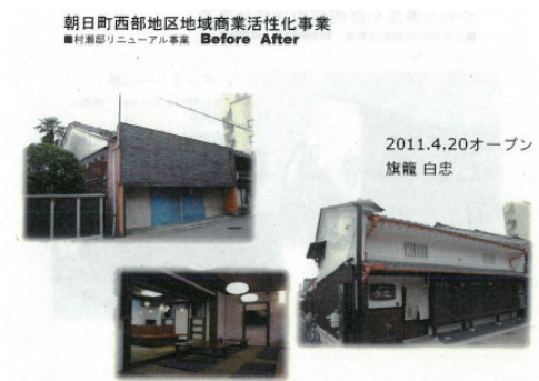
〈그림 8〉 상가 리모델링 사례