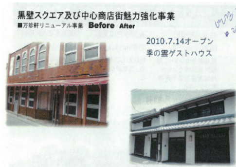
〈그림 4〉 중심상점가 리모델링 사례