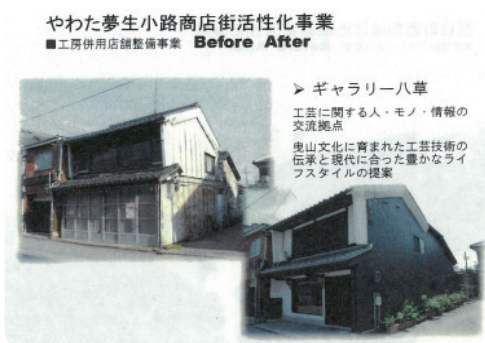
〈그림 7〉 상가 리모델링 사례