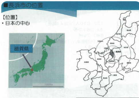
〈그림 3〉 나가하마시 위치도