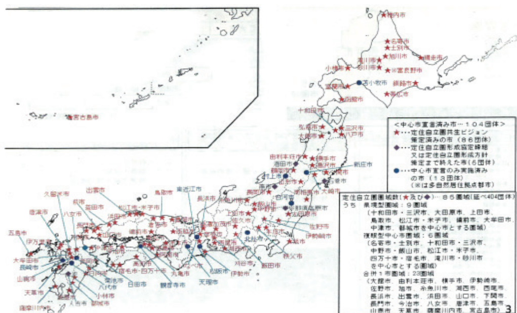
〈그림 1〉 일본의 정주자립권 현황

우리나라의 생활권 정책과 유사한 일본의 정주자립권 정책은 2009년 도입되었다. 사업의 방식은 중심시와 주변 시정촌의 협력과 역할 분담을 통하여 주민에게 필요한 서비스를 제공하는 것이다. 시설 입지시 관련 기능을 집약하여 공급하고, 주변 시정촌은 중심지의 집약된 기능을 활용할 수 있도록 네트워크 체계를 형성하는 것이다. 이러한 서비스 공급으로 효율성을 높이고 자원의 중복 투자를 방지하는 방안을 모색하고 있다. 이러한 정책의 추진 사례는 2015년 기준으로 총 85개 권역에서 시행하고 있다. 권역 중심의 개발을 추진하고 있는 일본의 사례를 조사하기 위하여 나가하마시 정주자립권 계획 관련 공무원과의 인터뷰를 실시하였다.