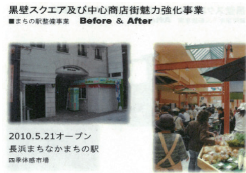
〈그림 6〉 중심상점가 리모델링 사례