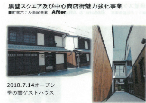
〈그림 5〉 중심상점가 리모델링 사례