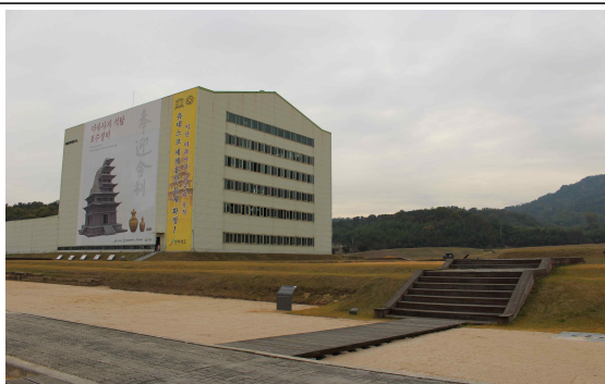
미륵사지 석탑 복구실 전경

○ 현재 백제역사유적지구의 단점도 긴 문화유산 보존/관리라는 측면 중 한 시점이며, 우리는 그 시점에서 ‘백제 문화와 역사’를 받아들일 수 있는 기회를 제공해야 함.