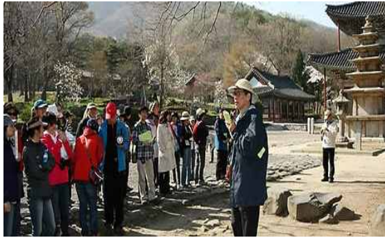
유흥준 전 문화재청장 해설사 활동 사례

○ 지속가능한 관광의 개념에는 지속가능한 발전에서 강조하고 있는 자연자원보존, 경제발전 및 지역주민의 참여라는 개념을 적용하여 “미래 관광발전의 기회를 보호, 강화하면서 관광객과 관광지의 요구를 충족시키는 관광”으로 정의할 수 있다(Inskeep, 1991). 더불어 ‘문화자원에 대한 보호, 관광객의 윤리의식이 함께 포함될 필요가 있으며, 지역경제 발전을 꾀하고, 주민의 참여를 강조하는 관광으로도 정의’할 수 있음 (민창기, 2009).