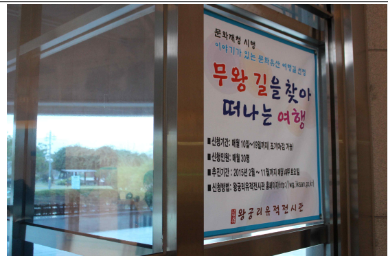
문화재청 시행 문화 답사 프로그램