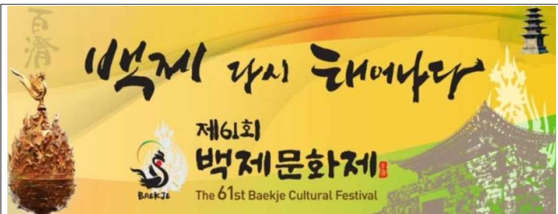
백제문화제 홍보 슬로건

향후 백제역사유적지구의 발전과 백제문화제는 별도의 운영 문제가 아닌 상호 발전적인 시너지 창출을 위한 역할 재조명이 필요할 것으로 판단됨.