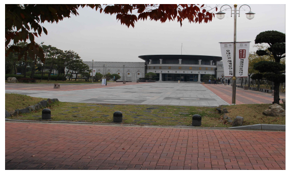
왕궁리 유적 전시관

○ WTO(United Nations, 2007)는 지속가능한 관광개발을 위해서는 “첫째, 환경자원의 이용 최적화를 통해 필수적 생태과정 유지와, 자연유산, 생물 다양성 보존에 일조해야 하며, 둘째, 관광지역 주민들의 터전과 삶의 양식에 관한 유산, 전통적 가치 등 사회문화적 진정성(authenticity)을 존중함으로써 각 문화에 대한 이해와 관용의 자세를 가져야 하고, 셋째, 각 지속 가능한 관광개발에 포함된 모든 이해관계자들에게 안정적인 고용과 소득 수입을 공정하게 배분하고 실행 가능한 사회·경제적 혜택을 장기적으로 수여할 수 있도록 그 경제적 운영을 보장해야 함. 또한 이를 통해 지역사회 개발 기회의 공평한 제공과 빈곤 완화에도 도움이 되어야 한다”는 등 3가지 측면의 고려사항을 제시함.