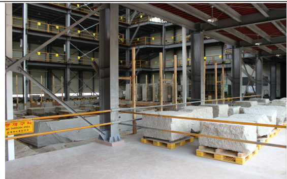
미륵사지 석탑 복구 과정