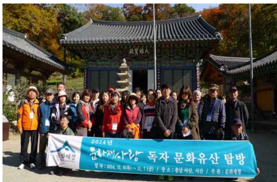
문화재청 문화유산 탐방 사례

○ 문화재청은 정책고객과 문화재청 소식지인 월간 ‘문화재사랑’ 애독자를 대상으로 매년 번갈아 문화유산 탐방을 시행하고 있으며, 현장에서 수렴한 의견은 정책에 적극 반영하고 있다. 문화재청은 앞으로도 국민이 자유롭게 생각과 소견을 밝힐 수 있는 자리를 지속적으로 마련하여 국민의 눈높이에 맞는 만족도 높은 정책을 펼칠 수 있도록 힘써 나갈 계획임.