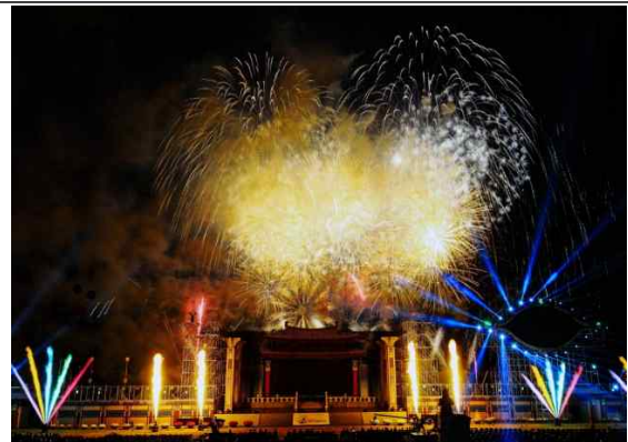
백제문화제 중부권 최대 불꽃 축제