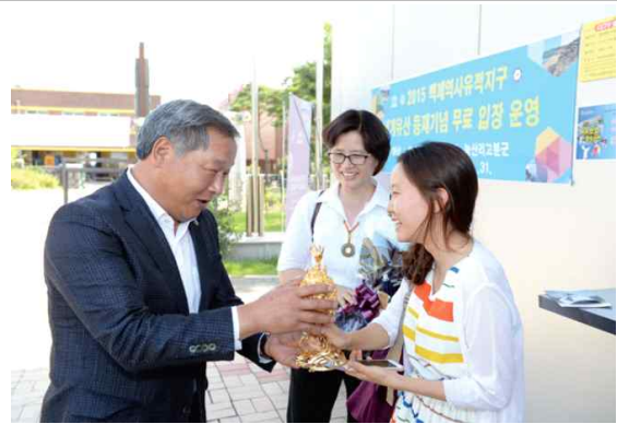
정림사지 10만번째 방문 기념행사