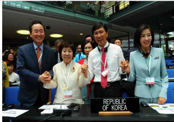
유네스코 세계유산 등재 확정 순간