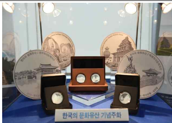
한국은행 발행 기념주화

백제역사유적지구 기념주화는 앞면에 백제금동대향로로 상부를 표현하고, 뒤로 공주 공산성 전경이 배치됨. 뒷면에는 익산 미륵사지 석탑과 이 탑에서 출토된 금제사리호, 유리구슬 등이 삽입됨.