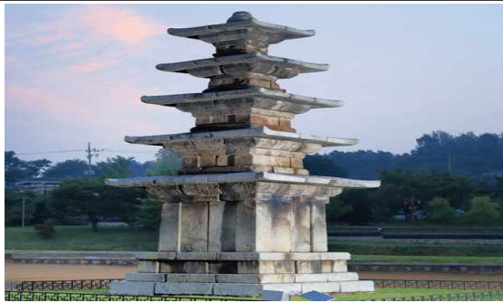
정림사지 5층 석탑