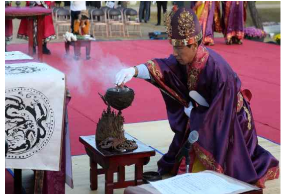
고유제 중 초헌례 모습