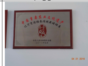
석주인삼 중국농업유산 지정서