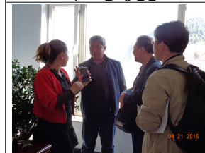
석주마을 부녀회장 설명