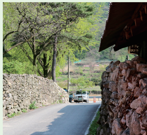
〈상신마을은 돌담이 유명해 일명 ‘돌담풍경마을’로 불린다〉