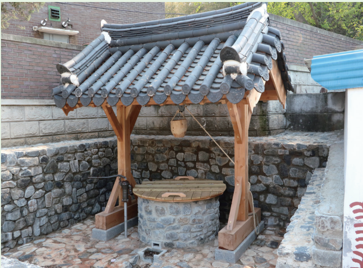
〈마을 한가운데 위치한 우물〉