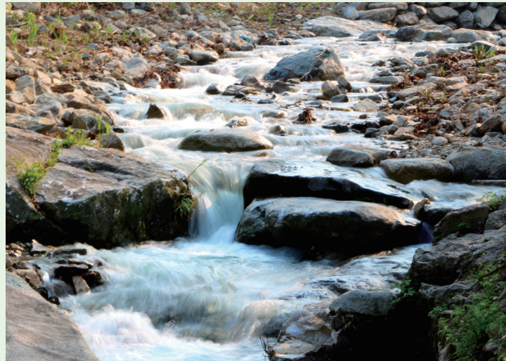
〈맨 왼쪽 위 '여천' 을 비롯한 마을 풍경〉