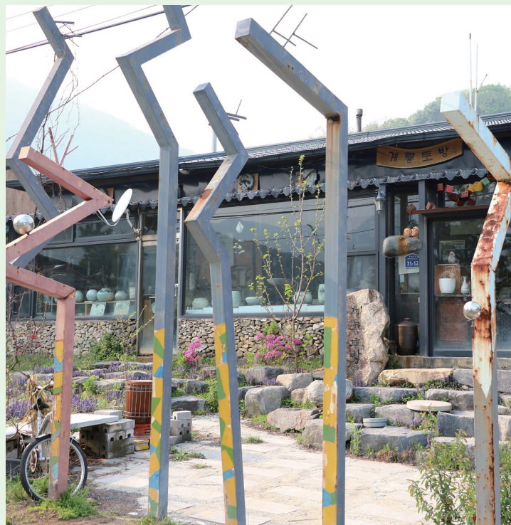
〈마을 오른쪽 언덕위에 자리잡은 계룡산도자예술촌 모습〉