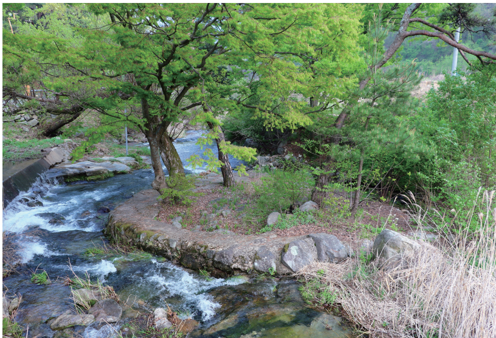
〈마을 초입 앞뒤넷가가 합류하는 지점에 생긴 '소도'의 모습〉

고 위원장은 “지난해 체험객수는 약3730명, 체험객 및 특산품 판매 등을 통한 연매출은 약46,300,000원으로 많은 편이 아니다”라며 “올해는 체험객 약 2만명, 2억원 매출 달성을 목표로 사업을 진행해보고 싶다”고 말했다.