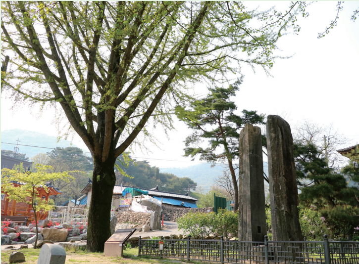
〈상신마을 당간지주 – 고려시대 구룡사의 당간지주로 추정됨〉