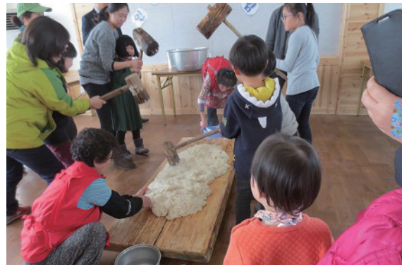
〈미꾸라지 잡기, 서당체험 등 다양한 체험프로그램 진행모습〉

특히 이 마을의 특색을 한마디로 정의한다면 토속신앙과 유교적 질서의 조화라 할 수 있다. 전통촌락의 유형 문화를 잘 보존하기 있기 때문에 마을 전체가 전통촌락박물관이라 표현해도 지나치지 않다. 예를 들면 상여집터, 용산구곡, 세이천, 소도, 장승, 선돌, 큰샘, 당간지주, 구룡사지, 여천, 산정이 서당터, 이참봉댁, 옷샘, 부도굴, 서당터, 산신당 등 마을 곳곳에 전시물이 자리하고 있다. 그래서인지 이 마을에서는 서당문화자원을 활용한 전통에 절체험과 서당체험을 할 수 있다고.