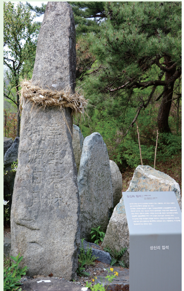
〈상신리 선돌(立石) – '상신 들녘의 춘하추동은 무릉도원의 세월이여라' 를 의미〉