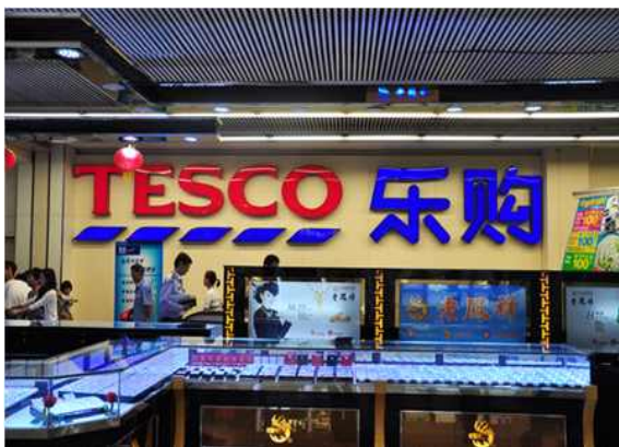
완다광장 조우푸점 지하마트