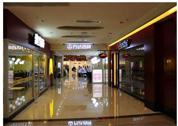
완다광장 조우푸점 백화