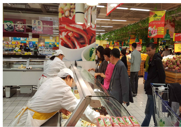
완다광장 조우푸점 지하마트