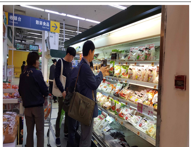
상하이 이마트 시장조사