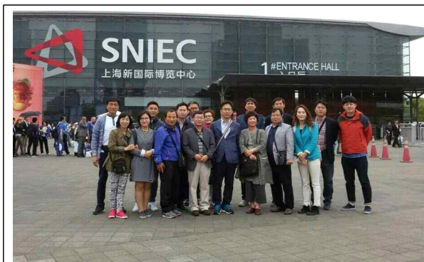
상하이 박람회 현장 사진