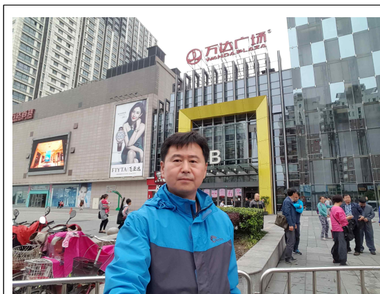
완다광장 조우푸점 시네마