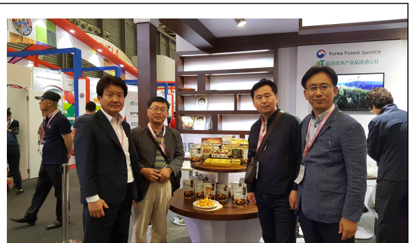
부여군 밤뜨래 전시장