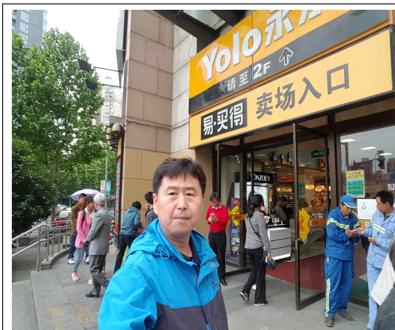
상하이 이마트 노서문점