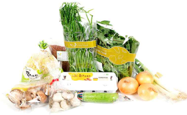
[그림 5-30] 완주군 건강한 밥상 시골꾸러미사업 사례