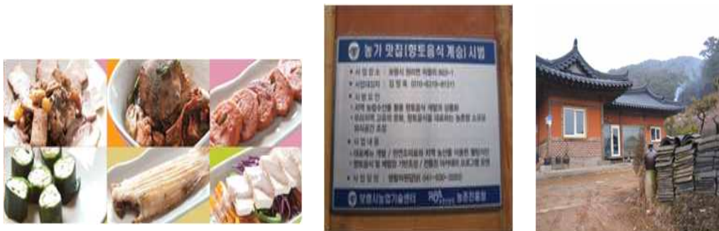
[그림 5-32] 보령시 Slow Food 책자발간 및 농가맛집 사례