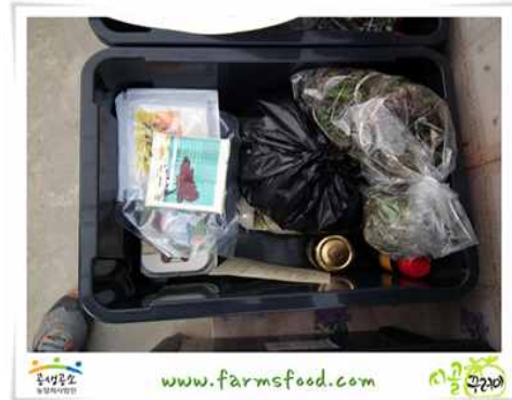
[그림 5-31] 공주시 공생공소 시골꾸러미사업 사례