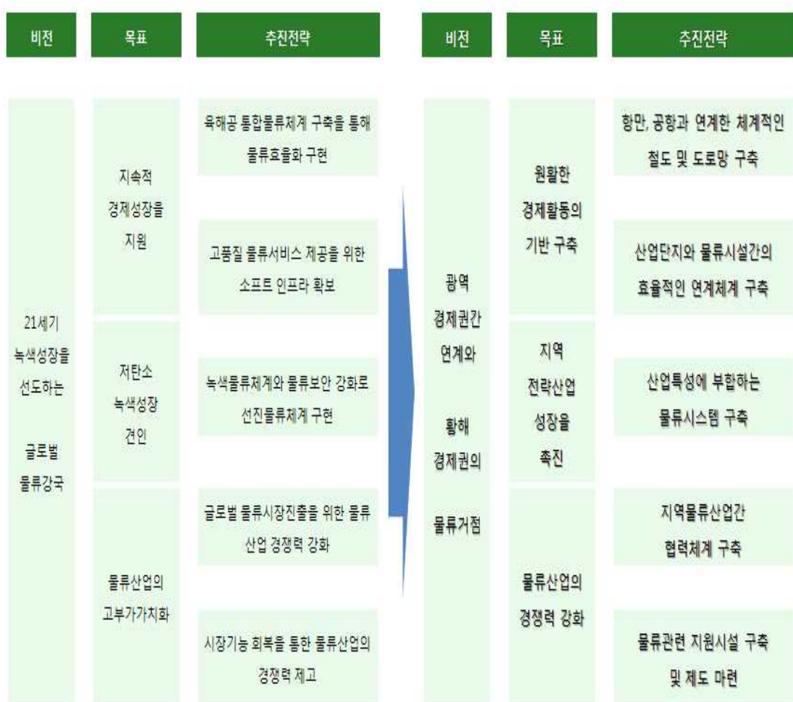
<그림 VII-1> 비전 및 추진전략

→ 중남 : (1)항만, 공항과 연계한 체계적인 철도 및 도로망 구축, (2)산업단지와 물류시설간의 효율적인 연계체계 구축, (3)산업특성에 부합하는 물류시스템 구축, (4)지역물류산업간 협력체계 구축, (5)물류관련 지원시설 구축 및 제도 마련