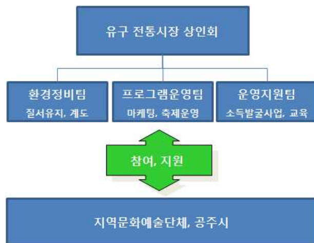
[그림 7-3] 유구 전통시장 상인회 조직(안)