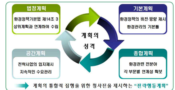
[그림 1-2] 환경보전종합계획의 성격