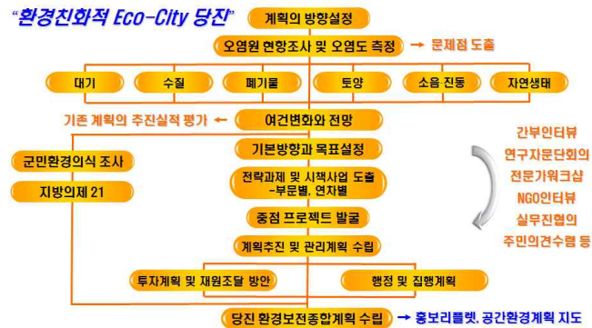
[그림1-6] 단계별 계획수립 추진 흐름도