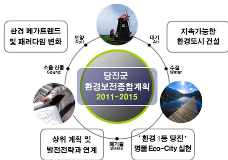
[그림 1-1] 계획수립의 배경