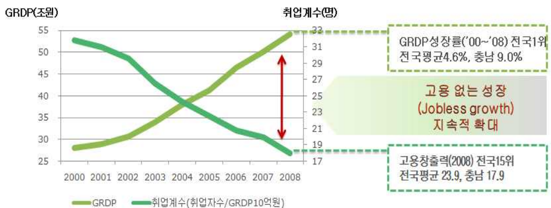
<그림 1> 도내 지역경제성장률 및 고용창출력 추이