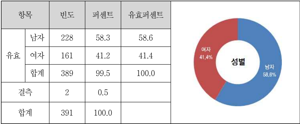
<표-28> 술바람길 방문객 성별