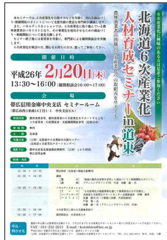
홋카이도 6차산업화 관련 연수회, 교류회 팸플릿