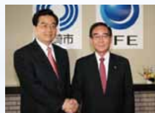
2008年5月胡锦涛中国国家主席が川崎エコタウンをご視察 Mr. Hu Jintao, General Secretary of the Communist Party of China Visited Kawasaki Ecotown, on May 2008