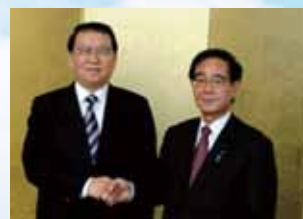
2009年4月李長春中国共産党常務委員が川崎エコタウンをご視察 Mr. Li Changchun, Member of the CPC Politburo Standing Committee of China Visited Kawasaki on April 2009