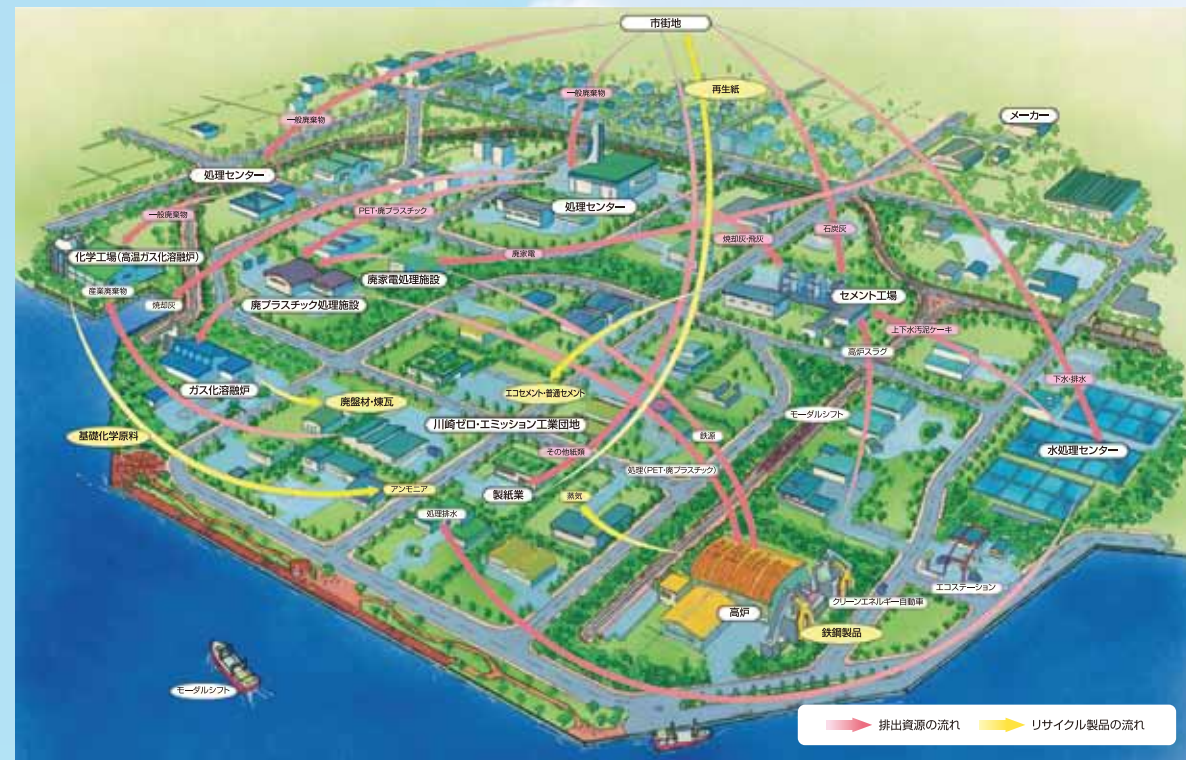
Image drawing of Kawasaki Eco-Town