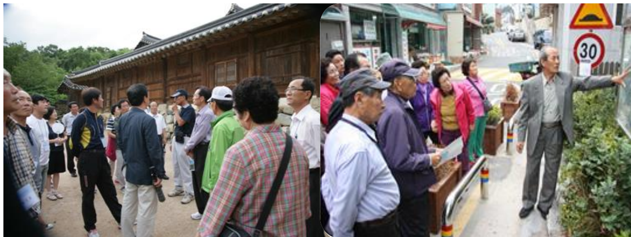
(경주 양동마을 현장 견학)