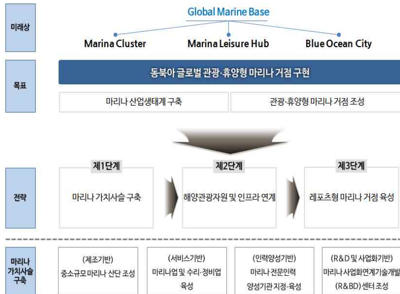
[그림 4-1] 충남 마리나산업 비전체계