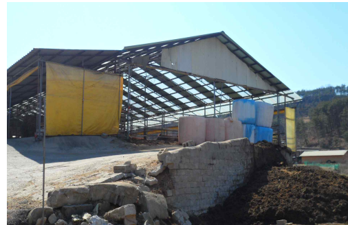
그림 2) 지붕, 가로막이 없이 방치된 분노