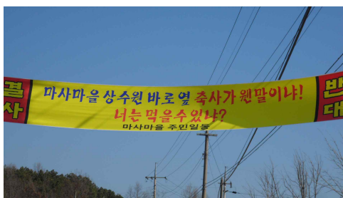
그림 7) 주민들의 축사신축 반대 활동