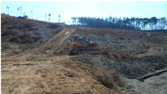
그림 1) 급경사에 조성되고 있는 목초지. 임목폐기물 불법처리가 의심됨.