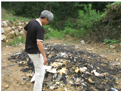
그림 3 축사 신축과정에서 불법으로 소각된 폐기물