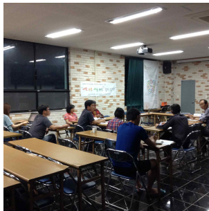
그림 4) 주민간담회