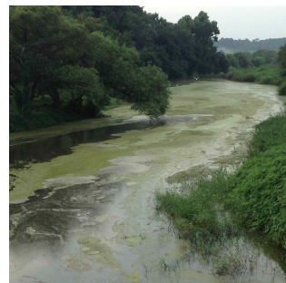
그림 5) 부유물이 가득한 홍동천