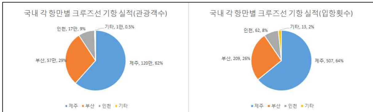
[ 그림 2 ] 2016년 국내 각 항만별 크루즈 관광객 수 및 입항횟수