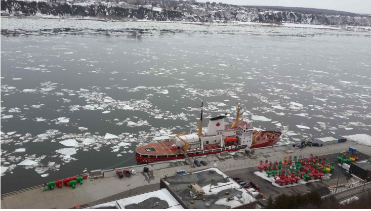
<세인트 로렌스강의 퀘벡 내륙항>