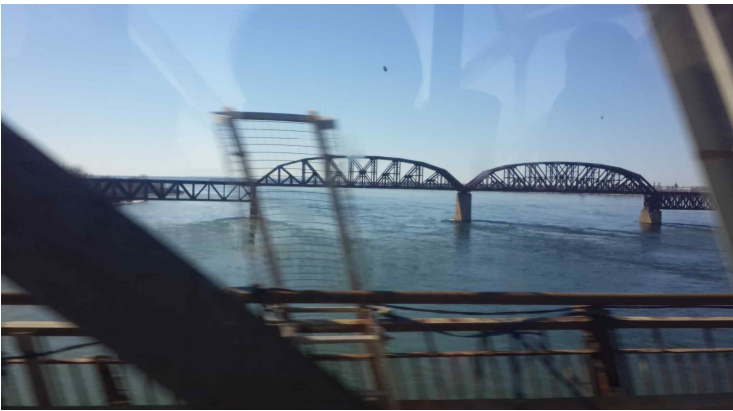
<세인트 로렌스강의 몬트리올 철교>