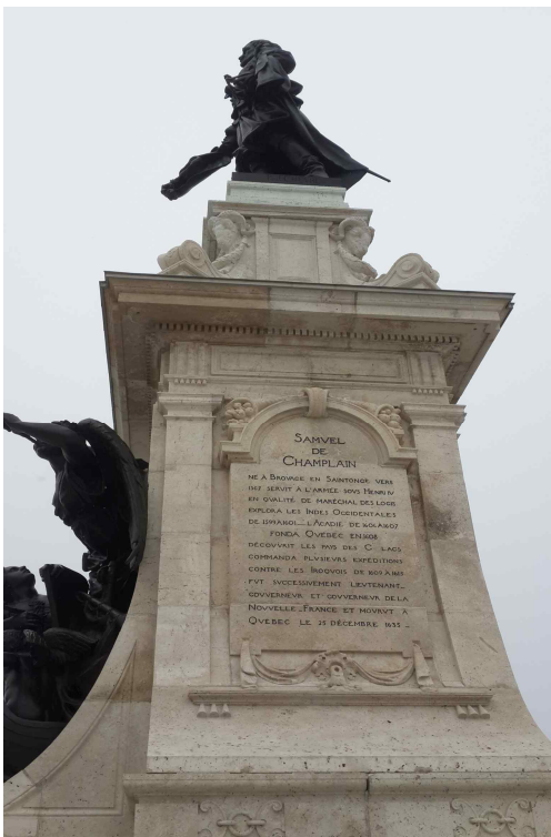
<몬트리올 도시개척자 샹플랭 동상>