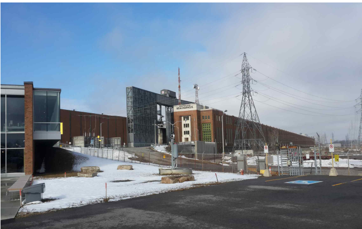
<세인트 로렌스강의 보하누아 수력발전소>