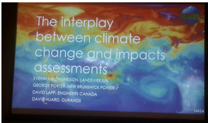
<기후변화와 영향평가 상호작용>