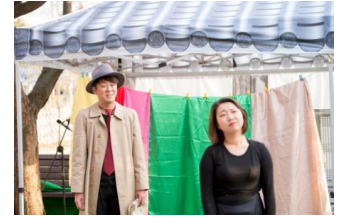
단종과 정순원후 〈창신동 붉게 물들었다〉