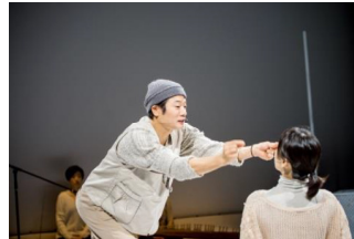
네팔 외연이야기 〈실 곶애〉