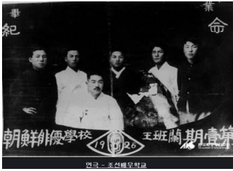
1925년 한국최초의 연극영화배우 양성전문학교