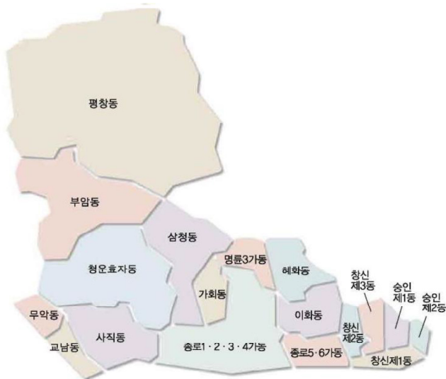
창신동 인구 현황