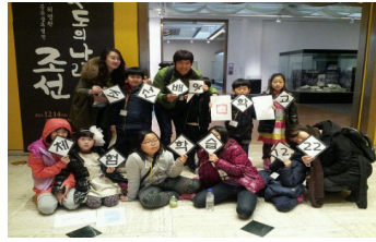
어린이 연극교실 <조선배우학교>