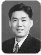
오운열 해양수산부 어촌양식정책관

오운열은 해양수산부 어촌양식정책관이다. 전남대학교에서 영문학과로 학사학위를 받고 서울대 행정대학원을 졸업했다. 국토해양부에서 일하며 공공주택개발과장, 해양정책과장을 맡았고 해양수산부에서는 운영지원과장을 맡았다. 2014년에는 여수유류오염사고수습대책 단장과 여수지방해양항만 청장을 역임하였다. 또한, 국제노동기구와 국정기획자문위원회에서 활동하였다.