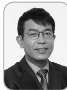
김종대 국회의원, 정의당

그리고 그가 편집자로 있는 Global Asia 등에 정기적으로 기고하는 등 한반도 이슈에 큰 관심을 가지고 있다. 현재 미중관계 및 북한 국가위원회 위원, 아시아소사이어티, 태평양세기연구소, 및 중국정책연구소 선임연구원, 국제전략문제연구소 연구원을 겸임 중이다. 예일대학교에서 역사학 전공으로 학사와 석사, 박사학위를 취득했다. 현재는 1950년대 미중관계에 관한 책을 쓰고 있다.