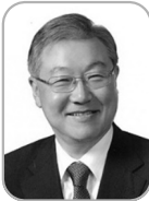
김성환 한양대 특훈교수/전 외교통상부 장관

또한, 그는 문재인정부의 국정기획자문위원회의 전문위원, 한중친선협회 자문위원 및 중 전문가공동연구위원회 위원으로 활동했다.