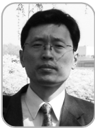
다즈강 흑룡강성 사회과학원 동북아연구소장

단행본(11권은 공동 저자 형태로 출간)을 포함하여 40편 이상의 학술 논문을 편찬하였다. 그는 50개 이상의 프로젝트와 프로그램에 초청되었으며 30개 이상의 시 단위, 성 단위, 국가 단위 정부의 서류의 초안을 작성하였다.