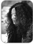
팡레이 전 송장미술관 관장

팡레이는 중국 송장아트센터의 전 관장이고, '설경 문화와 아트(SSA)'의 설립자이자 회장이다. 1971년생으로, 현재 현대 미술에 있어서 중요한 큐레이터이다. 팡레이는 1997년에 예술적, 큐레이터의 커리어를 시작하였다. 2005년에는 국제적으로 잘 알려진 '울렌스 현대예술센터(UCCA)'를 설립했다. 2012년에는 송장아트센터의 관장으로 취임하여, 2017년 6월에 임기를 마쳤다.