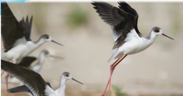
석지모니터링 조사 일정