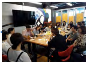
✓ 운영주체간 공간구성 토론회