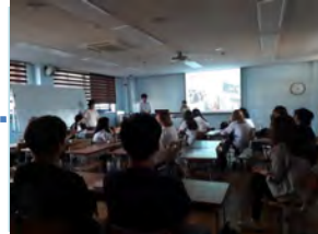
✓ 중간 공유회