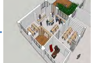
✓ 어울림 공간 도안