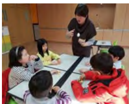
✓ 학부모 커뮤니티 역량강화