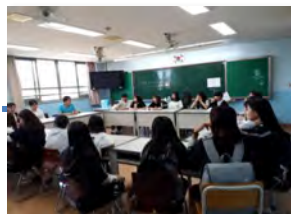
✓ 운영주체간 공감대 만들기