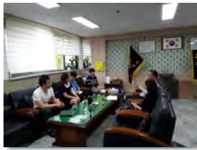
✓ 학교 공유공간 합의점 찾기