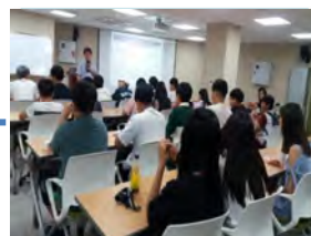
✓ 우수사례 학습여행