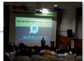
✓ 열린 창립총회, 운영 보고회